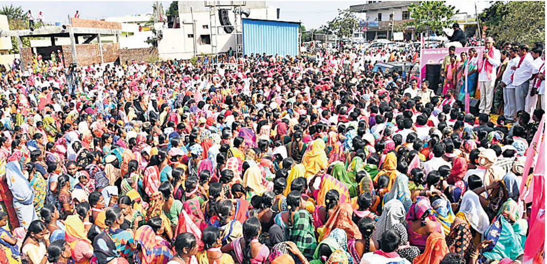
అక్కర్ పేట-భూంపల్లి మండల కేంద్రాల్లో మంత్రి హరీశ్ రావు రోడ్ షోకు హాజరైన ప్రజలు