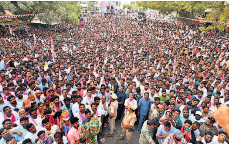
హనుమకొండ జిల్లా భీమదేవరపల్లి మండలం ముల్కూనూర్ చౌరస్తాలో మంత్రి కేటీఆర్ రోడ్ షోకు హాజరైన ప్రజలు

దాదాపు పూర్తి కావబోంది. ఈ ప్రాజెక్టుతో లక్ష ఎకరాలకు సాగునీరు అందుతుంది. సీఎం కేసీఆర్ పేదల కోసం ప్రవేశపెట్టిన సంక్షేమ పథకం అందని గడపలేదు. ప్రతిపక్షాల మాయలో పడొద్దు. నన్ను