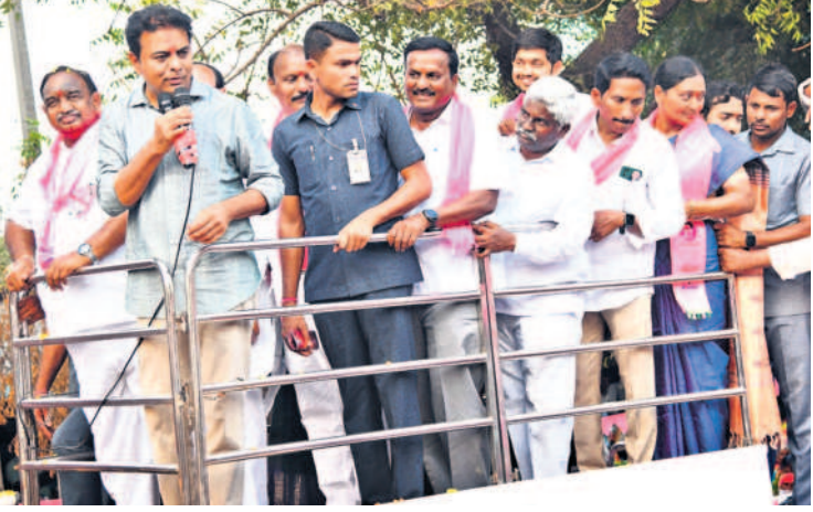
హనుమకొండ జిల్లా ముల్కూనూర్ చౌరస్తాలో మాట్లాడుతున్న మంత్రి కేటీఆర్

వ్యవసాయానికి 10హెక్టార్ మోటర్ వినియోగించే రైతు ఉన్నాడా అని మంత్రి కేటీఆర్ ప్రశ్నించారు. 'మూడు గంటల కఠింకతో మూడేకరాలు పండించే రైతులు మీ వద్ద ఉన్నారా' అని రైతులను అడిగి సమాధానం రాబట్టారు. 'మీకు వ్యవసాయానికి 24గంటల విద్యుత్ కావాలా, కాంగ్రెస్ అంటున్నట్లు 3గంటలూ ఆలోచించుకోవాలి' అని సూచించారు. దళారీ వ్యవస్థను అంగీకరిస్తారా? 'ఇక కాంగ్రెస్ మరో నాయకుడు భట్టి విక్రమార్క మాట్లాడుతూ మేము అధికారంలోకి వస్తే ధరణిని రద్దు చేస్తామంటున్నాడు. కేసీఆర్ ప్రభుత్వం రైతుల భూములకు రక్షణగా ధరణిని తీసుకొచ్చి పకడ్బందీగా రెవెన్యూ చట్టాలను అమలు చేస్తుంటే ఇప్పుడు కాంగ్రెస్ వాళ్లు ధరణిని తొలగించి మళ్లీ పటేల్, పటావర్, దళారీ వ్యవస్థలను ముందుకు తీసుకొస్తామని బాహాటంగా ప్రకటించండి విడూరంగా ఉండి.. ఈ వ్యవస్థను మీరు అంగీకరిస్తారా?' అని జవాబులు అడిగారు. 'రైతు బంధు పేరిట డబ్బును వృధా చేస్తున్నారని ఉత్తమ కుమార్ రెడ్డి అంటున్నారు, ఇప్పుడు ప్రభుత్వం