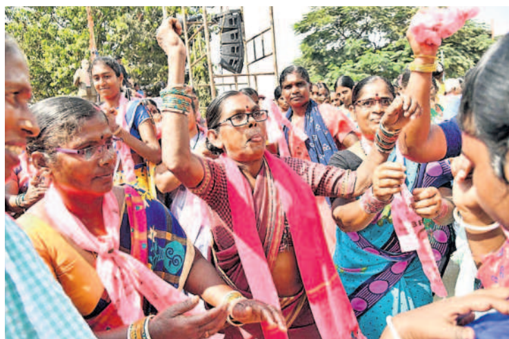
మిరుదొడ్డి రోడ్ షోలో డ్యాన్స్ చేస్తున్న వృద్ధురాలు