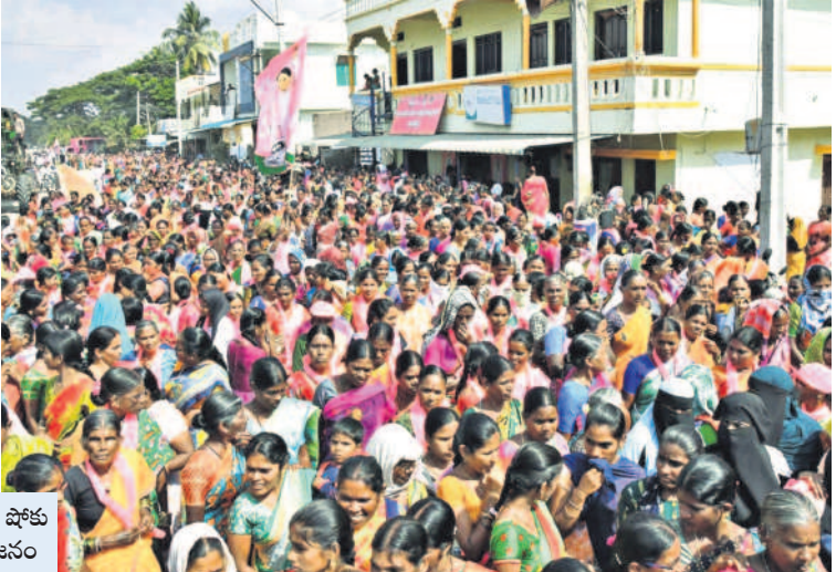
మిరుదొడ్డిలో రోడ్ షోకు హాజరైన అశేష జనం