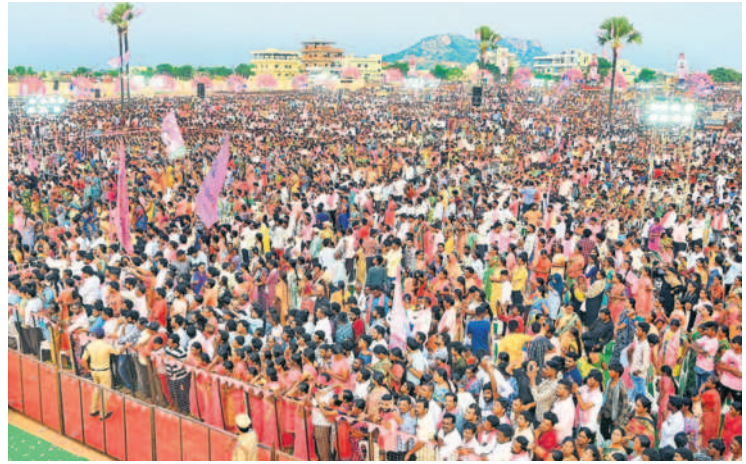
ఈ నెల 20న నల్లగొండలో సీఎం కేసీఆర్ ప్రజా ఆశీర్వాద సభకు పెద్ద ఎత్తున హాజరైన జనజన సందోహం (ఫైల్)