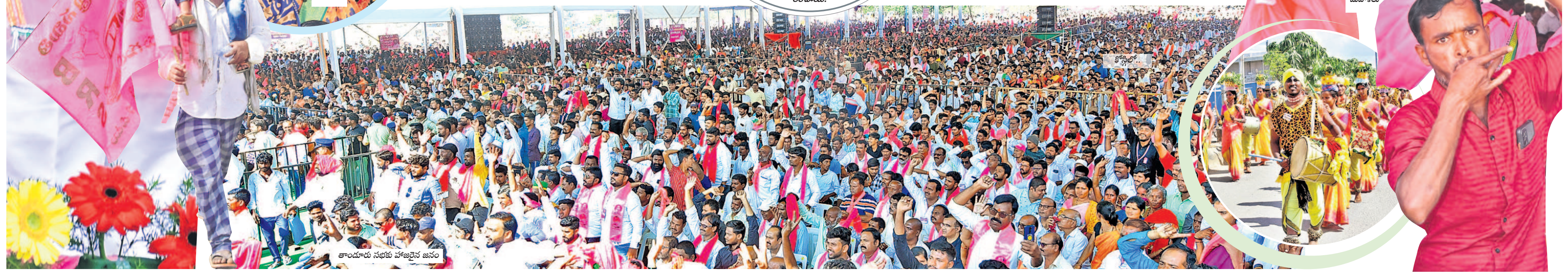
తాండూరు సభకు హాజరైన జనం