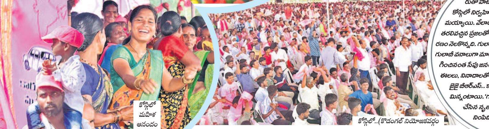
కోస్టిలో మహిళా ఆనందం