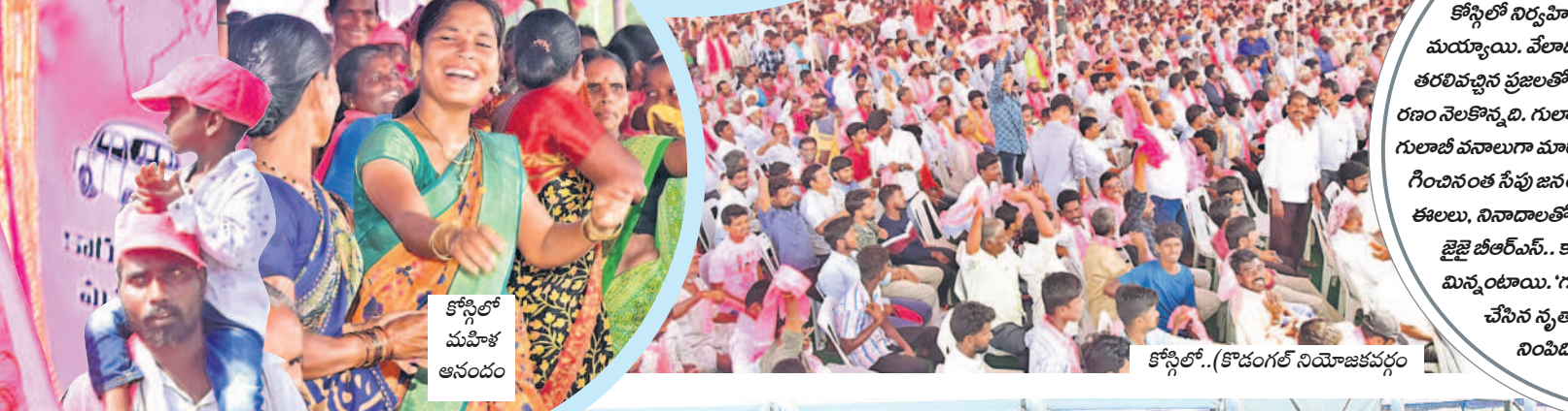
కోస్గిలో.. (కొడంగల్ నియోజకవర్గం)