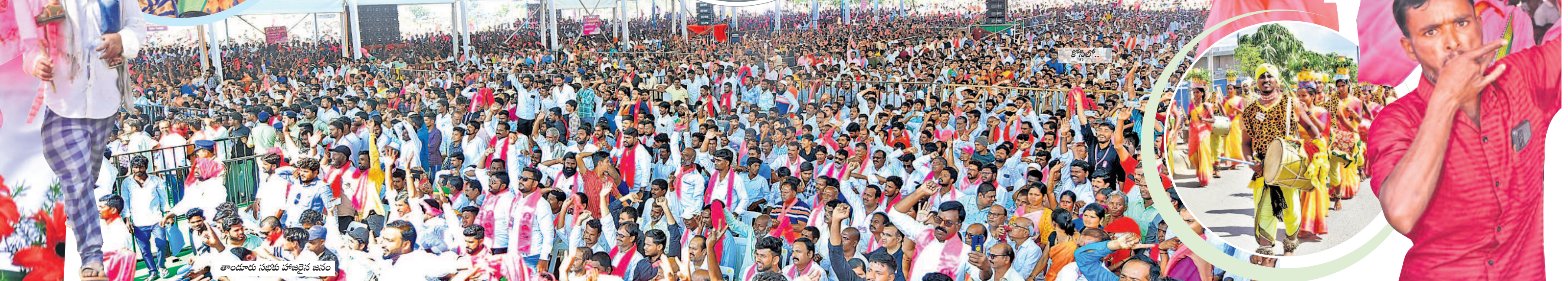
తాండూరు సభకు హాజరైన జనం