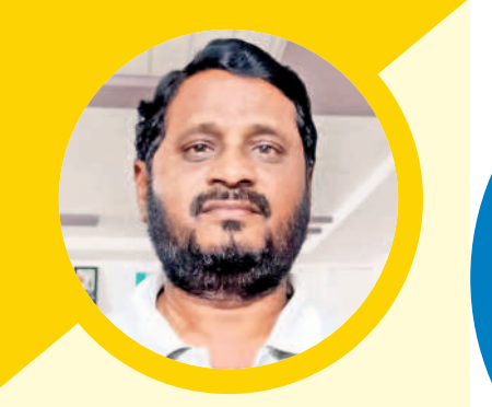
ధరణితోనే రైతులకు మేలు..

హనుమకొండ : తెలంగాణ ప్రభుత్వం తీసుకొచ్చిన ధరణితో రైతులకు మేలే జరుగుతుంది. ఇప్పుడు పైరవీలు లేవు. దశారు వ్యవస్థ లేదు. గతంలో మాదిరిగా అధికారులు, కార్యాలయాల చుట్టూ తిరగాల్సి అవసరం లేదు. అరగంటల్లో రిజిస్ట్రేషన్ ప్రక్రియ పూర్తయి పత్రాలు రైతుల చేతికి అందుతున్నాయి. రైతుల భూమిలపై ఇంకొకటి హక్కు ఉండదు. సంబంధిత యజమాని వేలిముద్ర వేస్తేనే భూమి బదలాయింపు జరుగుతుంది. గతంలో మాదిరిగా అవకతవకలకు తావులేదు. ధరణిని రద్దు చేస్తే పాతకాలం పరిస్థితులు రావడంతో పాటు పైరవీలయ్యాయి పెరుగుతాయి. రైతులకు తెలియకుండానే గోల్ మార్ జరిగి ఆనారం ఉంది. కాంగ్రెస్ అధికారంలోకి వస్తే ధరణి తీసివేస్తామని అంటున్నారు. వారి వ్యవహారం చూస్తే రైతుల మధ్య మళ్ళీ అగాధం పెంచే ప్రయత్నం చేస్తున్నారని అర్థం అవుతుంది. అలాగే పట్టణ వ్యవస్థ వస్తే మళ్ళీ రైతులకు గోస తప్పదు. పట్టణ దారు స్థానంలో అనుభవం దారు, మాన్యువారు పేరు పెడితే అసలు పట్టణాలకు కష్టాలు మొదలవుతాయి. సీఎం కేసీఆర్ తోనే మా కష్టాలు తీరనయ్యాయి. ఆయన వెంటే ఉంటాం.