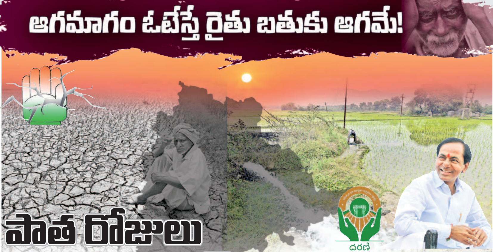
- నవన్ద్ర తిలకాచారి, నవంబర్ 22

దేశాన్ని దాదాపు 60 సంవత్సరాలు పాలించిన కాంగ్రెస్, రైతుల కష్టాలను ఏనాడైనా తీర్చింది.. నాడు కరింటు ఎప్పుడు వస్తోందో ఎప్పుడు పోతందో తెల్లని పరిస్థితి. రాత్రిపూట చేస్తూకాడికి పోయి పాములు, విష పురుగులు కుళ్ళి ఎంతమంది నశిపోయిస్తూ.. ఉండీలేని కరింటు తోని పాపాలు తడువక అన్ని పాపాలు అందిపోయినయ్యాయి.. అవన్నీ ఎట్లా మర్చిపోతం.. అంటున్నరు రైతులు. వ్యవసాయానికి కాంగ్రెస్ మూడు గంటల కరింటు చాలంటున్నదని, మూడు గంటలకంటే మూడు మడులు కూడా తడువయని, ఎప్పుడు తెలుసుకోళ్ళు ఇలానే మాట్లాడుతారని ఎద్దేవా చేస్తున్నారు. 10 హెక్టార్ల మీద మోటర్లకు కరింటు అంతకాలాలే.. ఇప్పుడు రైతుల పాపాలన్నీ 10 హెక్టార్ల మీద మోటర్లకు ఎవరు పెట్టాలి అని ప్రశ్నిస్తున్నారు. అంతపెద్ద మోటరు పెడితే బోరు బావుల్లో ఉంటుంటే అది అడుగుతున్నారు. కాంగ్రెస్ వాళ్ళ వల్లే కామి చేతుల్లో పైసలు లేక బక్కవడ్డమని, తెలంగాణ ప్రభుత్వం వచ్చాకనే నాలుగు పైసలు కనపడుతున్నయని చెబుతున్నారు. 24 గంటల కరింటు తోని ఇప్పుడు రరించేతుంటు ఎప్పుడం చేసుకుంటున్నామని, మళ్ళీ పాతపోతాను వడ్డం తెగిన చెబుతున్నారు. ధరణిని తీసిన భూమాతను తెన్నామని కాంగ్రెస్ పోళ్ళు అంటున్నారు. వాళ్ళ తీరు చూస్తుంటే మళ్ళీ దశలు వ్యవస్థను తెచ్చడం తోనామని చూస్తున్నారని అర్థమవుతోందంటున్నారు. ఇప్పుడు ధరణితో భూముల రిజిస్ట్రేషన్లు నిమిషాల్లోనే పూర్తవుతున్నాయని, చాలా సమస్యలు వరిపూర్వం సంతకేమి వధకాలు అందుతున్నాయని, ఇంత మంచి పోర్టల్ ను తీసిన మళ్ళీ కొట్లాటలు పెళ్ళి పాత వ్యవస్థను తెన్నామనడం ఏవద్దతని ప్రశ్నిస్తున్నారు.