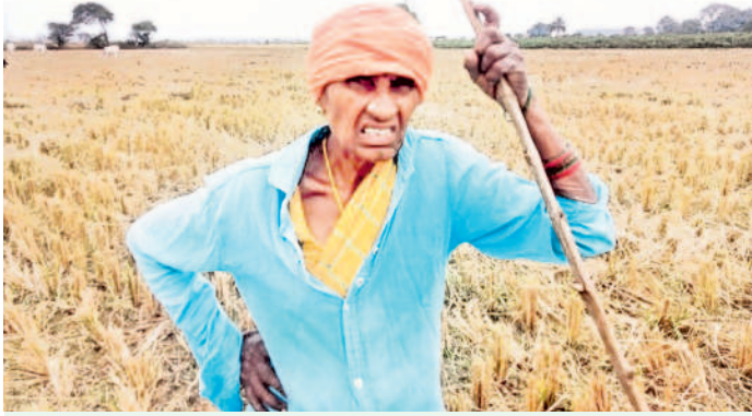
మళ్ళీ బీఆర్ఎస్ ప్రభుత్వమే రావాలి..

నర్సంపేట రూరల్: గతంలో పట్టణ వ్యవస్థతో అనేక కష్టాలు పడ్డాం. సీఎం కేసీఆర్ వల్ల ప్రస్తుతం ఆ బాధలు తప్పినయ్యాయి. మళ్ళీ బీఆర్ఎస్ ప్రభుత్వం వస్తేనే బాగుంటుంది. కాంగ్రెస్ తో అప్పకష్టాలు పడ్డాయి. సంవత్సరాల తరబడి ఆఫీసుల చుట్టూ తిరిగినా భూమి పట్టాలు కాలేదు. తెలంగాణ ప్రభుత్వం ధరణితో పట్టా అందించింది. నాకు ఉన్న ఎకరంలో 20 గంటలు నావేరిల పట్టా ఎక్కించుకున్నాను. నా కూతురు వేరిల మరో 20 గంటలు భూమి ఎక్కించి పెండ్లి చేశాను. రైతులందఱు పైసలు ఇద్దరికీ పడుతున్నాయి.