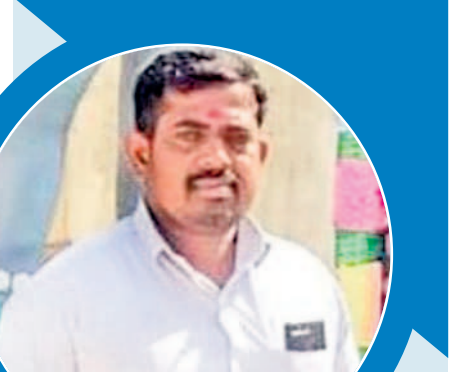
కాంగ్రెస్ కు తగిన బుద్ధి చెప్పాలి

సంగం : 3 గంటల కరింటు రైతులకు ఎట్లా సరిపోతది. మడులు కూడా సరిగ్గా తడవవు. రైతులను మోసం చేసేందుకే కాంగ్రెస్ నీతలు దిక్కుమాలిన మాటలు మాట్లాడుతున్నారు. ప్రస్తుతం 24 గంటల కరింటును ప్రభుత్వం ఇస్తున్నది. రైతులు ఇప్పుడున్న సమయంలో వెళ్ళి పంటలకు నీరు పారిస్తుకుంటున్నారు. ఎక్కువగా 3 హెక్టార్ల మీద మోటర్లకు వాడుతున్నారు. కాంగ్రెస్ వాళ్ళు 3 గంటల కరింటు సరిపోతుంది అని చెప్పడం సిగ్గుచేటు. 10 హెక్టార్ల మీద మోటర్లకు వెళ్ళుకోవాలనడం సరికాదు. 10 హెక్టార్ల మీద మోటర్లతో పాటు ఉంటాయా? అందరూ ఓకేసారి మోటర్ల వేస్తే ట్రాన్స్ ఫార్మర్లు కాలిపోతాయి. కాంగ్రెస్ పాక్ కి తగిన బుద్ధి చెప్పాల్సింది.