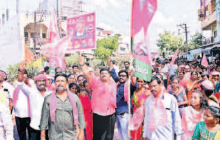
ఎన్నికల ప్రచారంలో బీఆర్ఎస్ జెండాలు చేతబూని జై తెలంగాణ ని నాదాలు చేస్తున్న కార్యకర్తలు