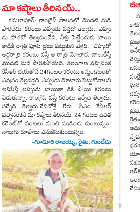
నీ ఓటు ఎవరికే? తెలంగాణమా తేల్చుకో