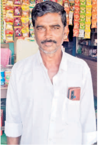
నీ ఓటు ఎవరికే? తెలంగాణమా తేల్చుకో