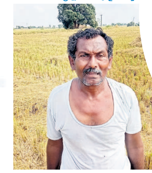
నర్సంపేట రూరల్: వ్యవసాయానికి మూడు గంటల కరెంటు సరిపోతుంది