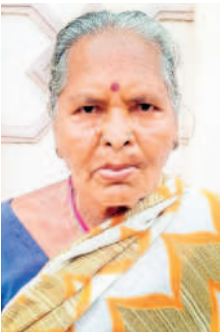
24 గంటల కరెంటు ఉన్న బీఆర్ఎస్ రైతుల మద్దతు