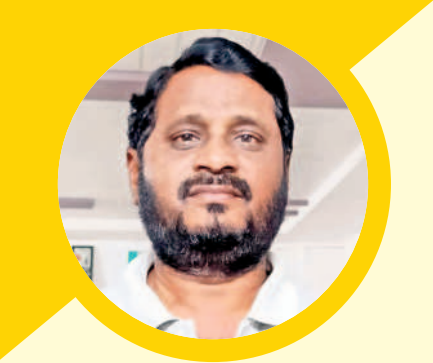
ధరణితోనే రైతులకు మేలు..

దేశాన్ని దాదాపు 60 ఏండ్లు పాలించిన కాంగ్రెస్, రైతుల కష్టాలను ఏనాడైనా తీర్చింది.. నాడు కరెంటు అప్పుడు వస్తోంది అప్పుడు పోతేనే తెల్లని పరిస్థితి. రాత్రిపూట చేస్తాడికి పోయి పాములు, విష పురుగులు కుట్టి ఎంతమంది నశిపోయిస్తూ.. ఉండేలేని కరెంటు తోని పాపాలు తడువక అన్ని పాపాలు అందిపోయినయ్యాయి.. అవన్నీ ఎట్లా మర్చిపోతం.. అంటున్నరు రైతులు. వ్యవసాయానికి కాంగ్రెస్ మూడు గంటల కరెంటు చాలంటున్నదని, మూడు గంటలకంటే మూడు మడులు కూడా తడువయని, ఎప్పుడు తెల్లని పోర్టల్ ఇలానే మాట్లాడుతారని ఎద్దేవా చేస్తున్నారు. 10హెచ్ఎస్ మోటర్లకు కరెంటు అంతకాలాలే.. ఇప్పుడు రైతుల పాపాలన్నీ 10 హెచ్ఎస్ మోటర్లు ఎవరు పెట్టాలి అని ప్రశ్నిస్తున్నారు. అంతపెద్ద మోటరు పెడితే బోరు బావుల్లో ఉంటుంటే అది అడుగుతున్నారు. కాంగ్రెస్ వాళ్ల వల్లే కామి చేతుల్లో పైసలు లేక బక్కవడ్డమని, తెలంగాణ ప్రభుత్వం వచ్చాకనే నాలుగు పైసలు కనపడుతున్నయని చెబుతున్నారు. 24 గంటల కరెంటు తోని ఇప్పుడు రందిచేతుంటు అవునం చేసుకుంటున్నామని, మళ్ళీ పాతపోతామని వద్దని తెగిన చెబుతున్నారు. ధరణిని తీసే భూమాతను తెన్నామని కాంగ్రెస్ పోర్టల్ అంటున్నారని, వాళ్ల తీరు చూస్తుంటే మళ్ళీ దారుల వ్యవస్థను తెచ్చి దండుతామని చూస్తున్నారని అర్థమవుతోందంటున్నారు. ఇప్పుడు ధరణితో భూముల రిజిస్ట్రేషన్లు నిమిషాల్లోనే పూర్తవుతున్నాయని, చాలా సమస్యలు వరిపార్లమెంట్ సెక్షన్లు వధకాలు అందుతున్నాయని, ఇంత మంచి పోర్టల్ ను తీసేని మళ్ళీ కొట్టాడంటున్న పెళ్ళి పాత వ్యవస్థను తెన్నామనడం ఏంపద్ధతులు ప్రశ్నిస్తున్నారు. - నవన్య తెలంగాణ నవంబర్ 22