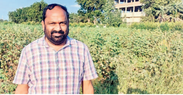
పరకాల: వస్తే ఎన్నికల్లో కాంగ్రెస్ మాయమాటలు చెప్పి రైతులను మోసం చేసేందుకు కుట్ర చేస్తోంది