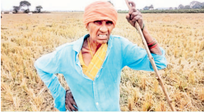
మళ్ళీ బీఆర్ఎస్ ప్రభుత్వమే రావాలి..