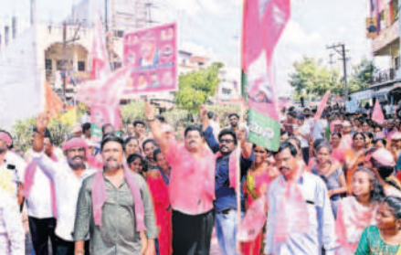
ఎన్నికల ప్రచారంలో బీఆర్ఎస్ జెండాలు చేతబూని జై తెలంగాణ ని నాదాలు చేస్తున్న కార్యకర్తలు