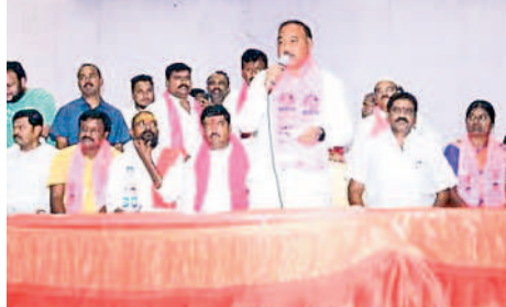
పోచమ్మమైదాన్: సమావేశంలో మాట్లాడుతున్న శాసన మండలి డిప్యూటీ చైర్మన్ బండా ప్రకాశ్