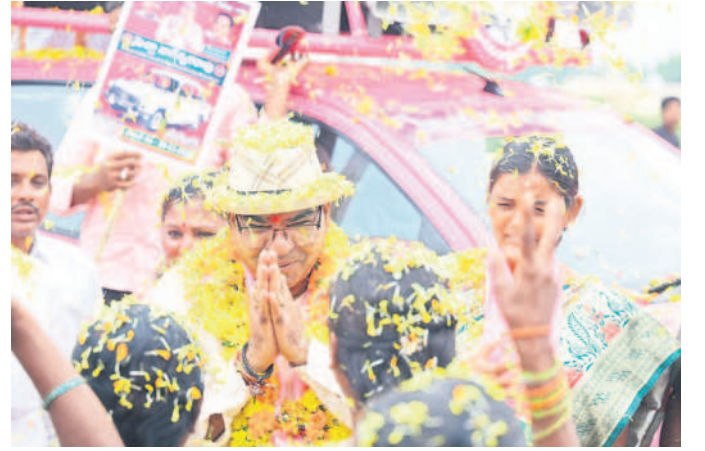
పూలతో మెచ్చాకు స్వాగతం పలుకుతున్న మహిళలు