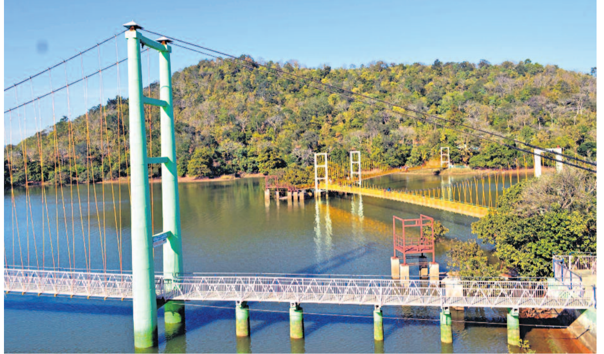
తెలంగాణ అవిద్యారంతో నీటి వెలుపల్లె, నిండు కుండలయ్యాయి. నేడు లక్షవరం మీనీ సంద్రాన్ని తలపిస్తున్నదంటే ముఖ్యమంత్రి కేసీఆర్ చొరవ కారణం. 2017లో రూ.5కోట్లతో లక్షవరం నరహస్య ప్రభుత్వం రెండో తీగల వంతెన కట్టించింది. నరహస్యలో ఉన్న రెండో ద్వీపాన్ని మూడో ద్వీపాన్ని అనుసంధానం చేస్తూ 2021లో రూ.2 కోట్లతో మరో తీగల వంతెనను ఏర్పాటు చేసింది. సౌకర్యాలూ మెరుగవడంతో వారాంతం వచ్చిందంటే.. పర్యాటక ప్రయులు చలో లక్షవరం అంటున్నారు.