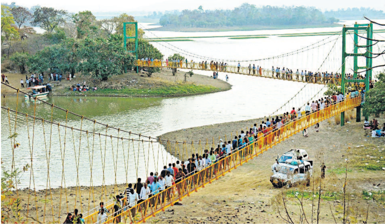
ఉమ్మడి రాష్ట్రంలో తెలంగాణ సంపదపై మూకుమ్మడి దాడి జరిగిందనడానికి లక్షవరం నరహస్య గ్రహణమే ఉదాహరణ. కాకతీయ రాజు ప్రతాపరుద్రుడి హయాంలో నిర్మితమైన ఈ అద్భుత సరస్సు కింద సుమారు 8,700 ఎకరాల ఆయకట్టు ఉండేది. ప్రకృతి అందాల నడుమ అక్షయమైన జల సందృఢితో ఇది అలరాలేది. కానీ, అప్పటి ప్రభుత్వాల నిర్లక్ష్య దౌరజీవితం లక్షవరానికి శాపంగా వలనమింది. నరహస్య బాగోగులు గాలికొదిలారు. వర్షాటకంగాను చిన్నచూపు మాకారు.