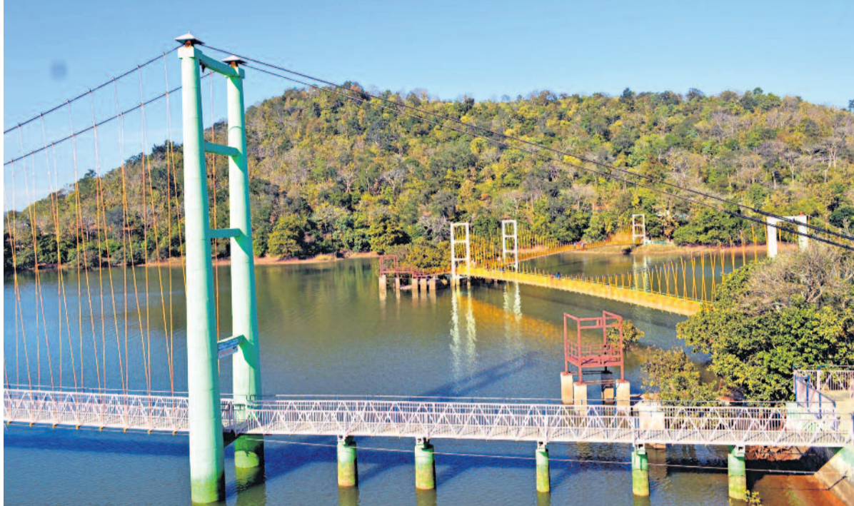
తెలంగాణ అవిద్యారంతో నీటి వెలుపల్లె, నిండు కుండలయ్యాయి. నేడు లక్షవరం మీనీ సంద్రాన్ని తలపిస్తున్నదంటే ముఖ్యమంత్రి కేసీఆర్ చొరవ కారణం. 2017లో దా.5కోట్లతో లక్షవరం సరస్సుపై ప్రభుత్వం రెండో తీగల వంతెన కట్టించింది. సరస్సులో ఉన్న రెండో ద్వీపాన్ని మూడో ద్వీపాన్ని అనుసంధానం చేస్తూ 2021లో దా.2 కోట్లతో మరో తీగల వంతెనను ఏర్పాటు చేసింది. సౌకర్యాలూ మెరుగవడంతో వారాంతం వచ్చిందంటే.. పర్యాటక ప్రయులు చలో లక్షవరం అంటున్నారు.