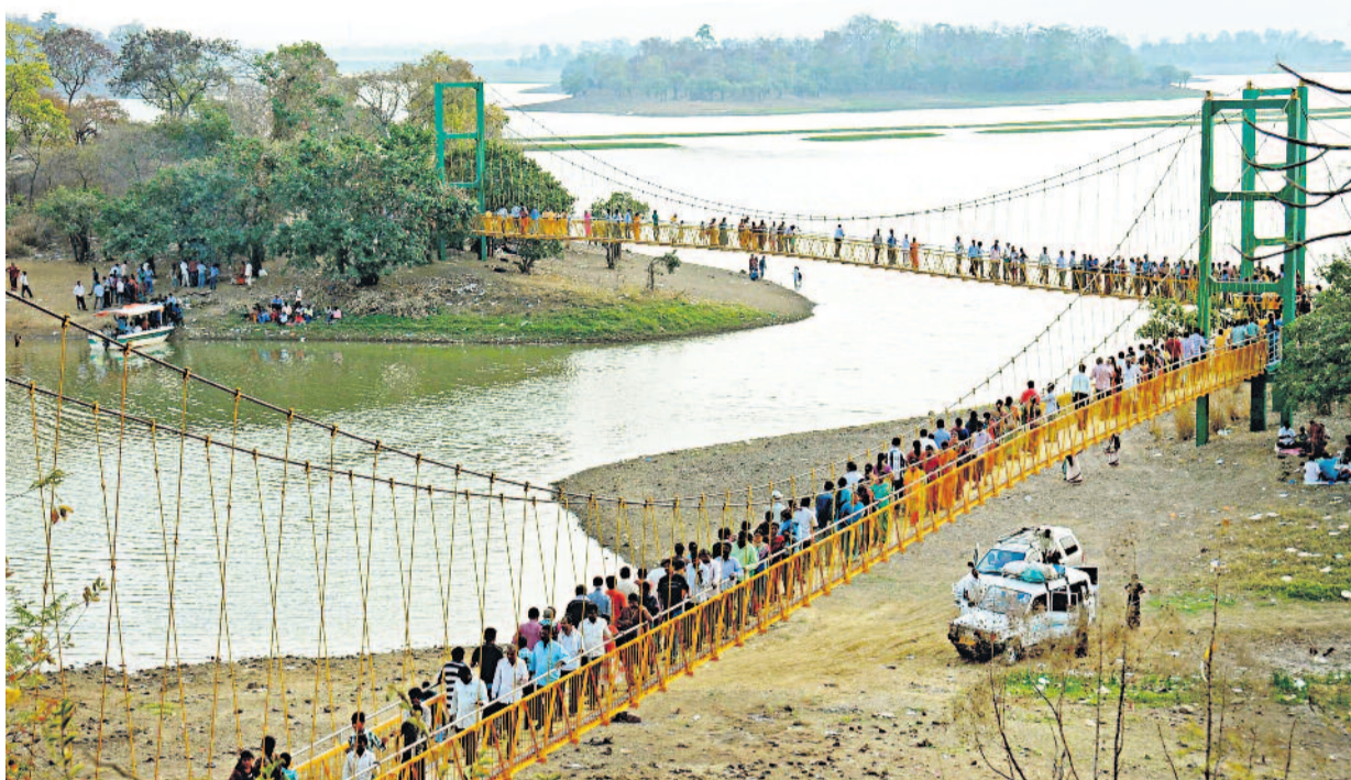
ఉమ్మడి రాష్ట్రంలో తెలంగాణ నందంపై మూకుమ్మడి దాడి జరిగిందనడానికి లక్షవరం నరహస్య పట్టణ గ్రహణమే ఉదాహరణ. కాకతీయ రాజు ప్రతాపరుద్రుడి హయాంలో నిర్మితమైన ఈ అద్భుత సరస్సు కింద సుమారు 8,700 ఎకరాల ఆయకట్టు ఉండేది. ప్రకృతి అందాల నడుమ అక్షయమైన జల సందృష్టితో ఇది అలరారేది. కానీ, అప్పటి ప్రభుత్వాల నిర్లక్ష్య దౌరజీవితం లక్షవరానికి శాపంగా వలనమింది. నరహస్య బాగ్ గులు గాలికొదిలారు. వర్షాటకంగాను చిన్నచూపు మాకారు.