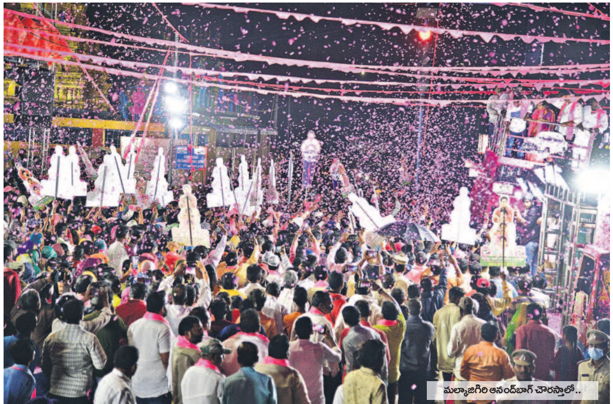
మల్కాజిగిరి ఆనంద్ బాగ్ చారస్టాలో..