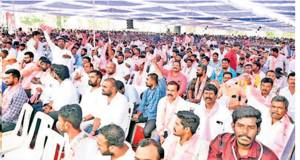
సభకు భారీగా హాజరైన జనం