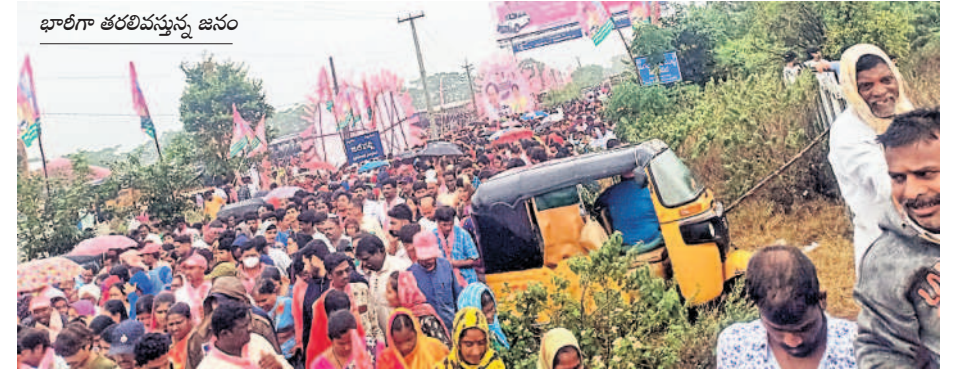
భారీగా తరలివస్తున్న జనం