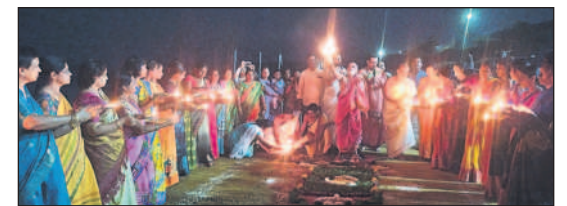
గోదావరి నదికి హారతినిస్తున్న భక్తులు, దేవస్నాన సిబ్బంది