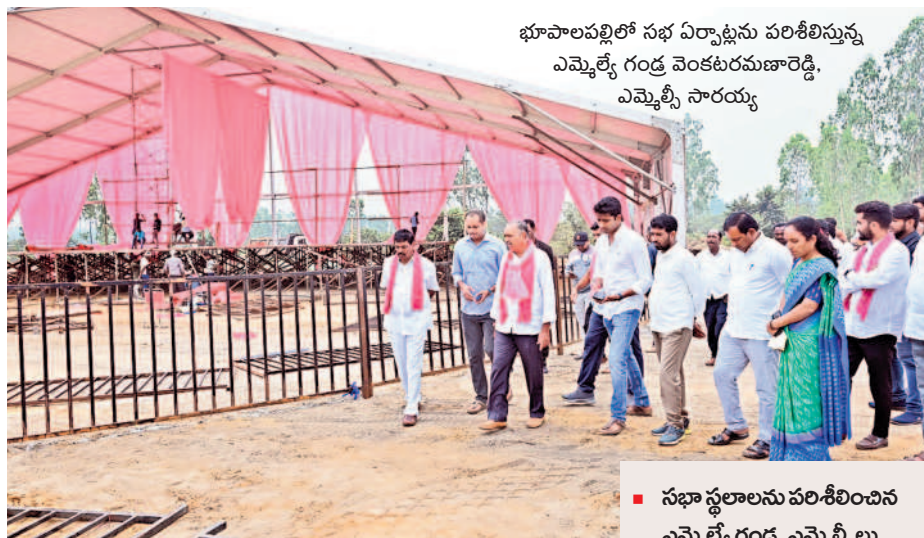
భూపాలపల్లిలో సభ ఏర్పాటును పరిశీలిస్తున్న ఎమ్మెల్యే గండ్ర వెంకటరమణారెడ్డి, ఎమ్మెల్యే సారయ్య