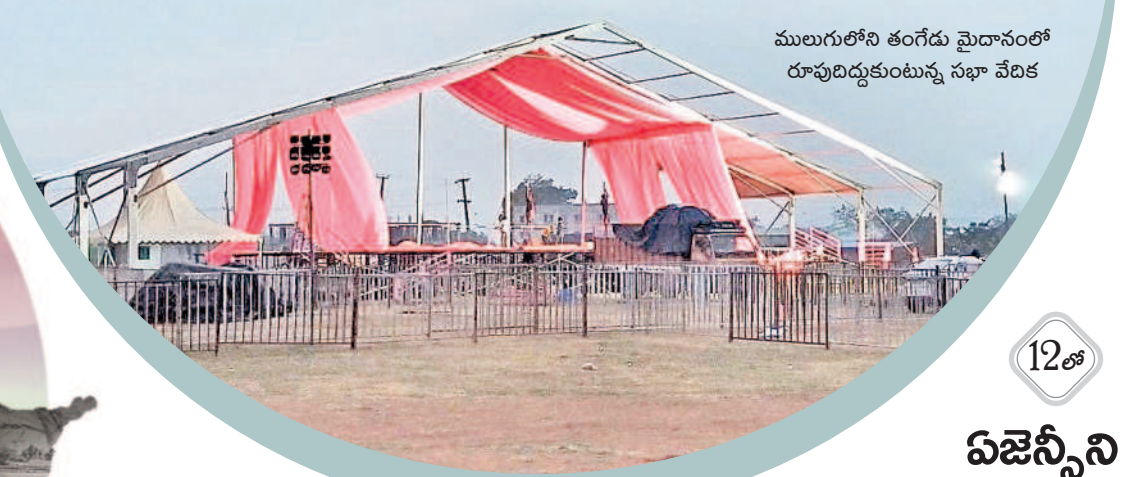
ములుగులోని తంగేడు మైదానంలో రూపుదిద్దుకుంటున్న సభా వేదిక