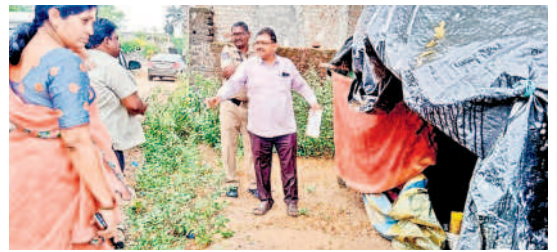
కొప్పలలో హోం ఓటింగ్ నిర్వహిస్తున్న అధికారులు