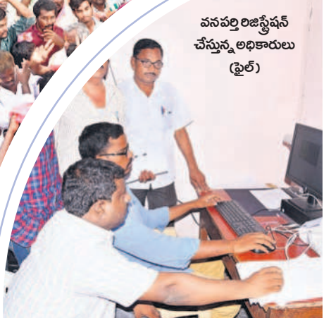
వనపర్తి రిజిస్ట్రేషన్ చేస్తున్న అధికారులు (ఫ్రైల్)