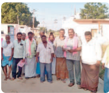
ఉండవెల్లిలో ప్రచారంలో పాల్గొన్న ఎంపీటీసీలు