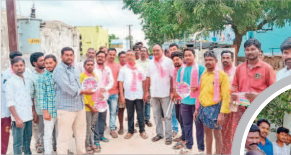
అలంపూరులో ప్రచారం చేస్తున్న బీఆర్ఎస్ శ్రేణులు