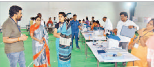
ఈవీఎంల కమిషనింగ్ పరిశీలిస్తున్న కలెక్టర్ వల్లూరు క్రాంతి