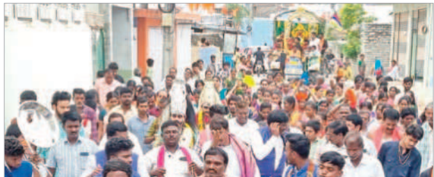
కాళికాదేవి విగ్రహాన్ని ఊరేగిస్తున్న భక్తులు

అయిజ, నవంబర్ 23 : పట్టణంలోని కాళికాదేవి ఆలయంలో ప్రతిష్ఠించనున్న కాళికాదేవి శిలా విగ్రహాన్ని వేద పండితుల మంత్రోచ్ఛరణలు, భాజా భజంత్రీలు, మంగళ వాయిద్యాల నడుమ ఊరేగింపు నిర్వహించారు. గురువారం ఉదయం వేద పండితుల మంత్రోచ్ఛరణల నడుమ ప్రతిష్ఠాపన మహోత్సవంలో భాగంగా పూజలు, హోమాలు నిర్వహించారు. అనంతరం కాళికాదేవి శిలావిగ్రహాన్ని ప్రత్యేకంగా అలంకరించిన వాహనంపై పట్టణంలోని పురవీధుల గుండా ఊరేగింపు చేశారు.