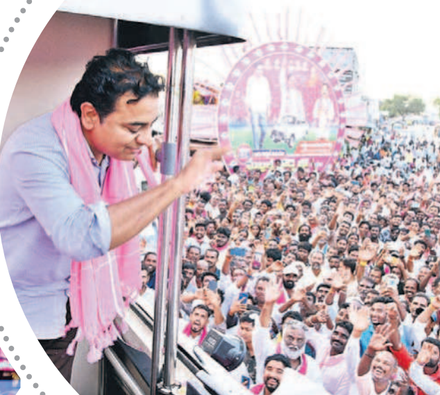
మక్తల్ రోడ్ పోలో ప్రజలకు అభిమానం చేస్తున్న మంత్రి కేటీఆర్