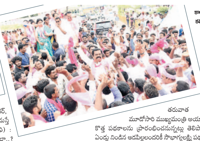
కార్యకర్తలతో కలిసి డ్యాన్స్ చేస్తున్న ఎమ్మెల్యే చిట్టెం