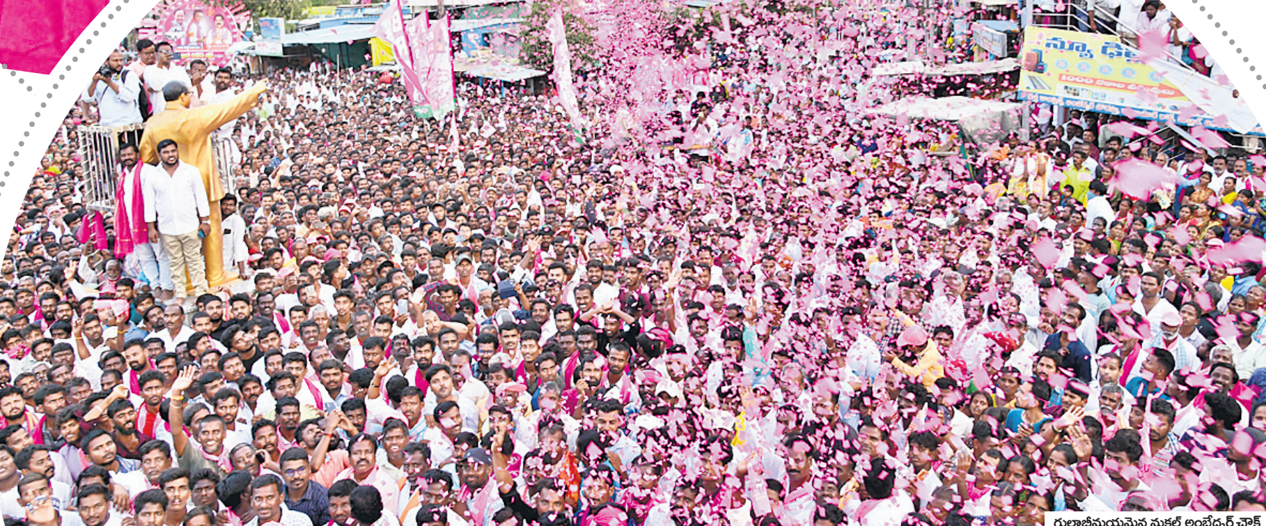
గులాబీమయమైన మక్తల్ అంబేద్కర్ చౌకీ