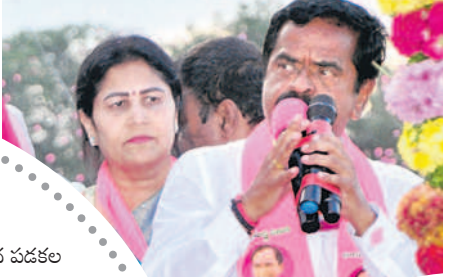
మక్తల్ రోడ్ పోలో ప్రజలకు అభిమానం చేస్తున్న మంత్రి కేటీఆర్