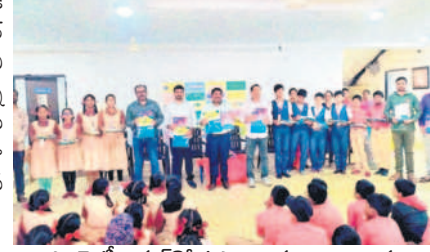
నాసా మెటీరియల్ తో ఉపాధ్యాయులు, విద్యార్థులు