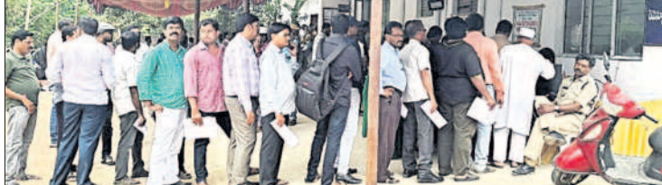
పోస్టల్ బ్యాలెట్ వేసేందుకు బారులు తీరిన ఉద్యోగులు

సర విభాగాల్లో విధులు నిర్వహించే వారు కూడా ఓటు హక్కును పోస్టల్ బ్యాలెట్ ద్వారానే వినియోగించుకుంటున్నారు. ఈనెల 20 నుంచి పోస్టల్ ఓట్ల ప్రక్రియ ప్రారంభం కాగా, ముగింపు గడువు సమీపిస్తున్న క్రమంలో రోజురోజుకు పోస్టల్ ఓట్ల సంఖ్య పెరుగుతుంది. ఒక్కో సెగ్మెంట్ పరిధిలో 300కు పైగా ఉద్యోగులు పోస్టల్ బ్యాలెట్లు వేస్తున్నట్లు ఎన్నికల అధికారులు పేర్కొంటున్నారు. గురువారం కరీంనగర్ అసెంబ్లీ రిటర్నింగ్ అధికారి కార్యాలయంలో ఉద్యోగులు వందల సంఖ్యలో బారులు తీరారు. వీరంతా రెండు ఫెసిలిటీషన్ కేంద్రాల్లో పోస్టల్ బ్యాలెట్ ద్వారా ఓటు హక్కు వినియోగించుకున్నారు. సాయంత్రం ఆరు గంటల వరకు కూడా ఓటు హక్కు వినియోగించుకునేందుకు ఉద్యోగులు ఆరేవో కార్యాలయానికి రావడం కనిపించింది. పోస్టల్ ఓట్లు వేసే విధానం కూడా ఈసారి ఎన్నికల కమిషన్ మార్చింది. గతంలో పంపిణీ కేంద్రాలతో పాటు పోలింగ్ విధులు నిర్వహించే కేంద్రంలో కూడా పోస్టల్ ఓటు వేసే అవకాశముండేది. అయితే, ఈసారి