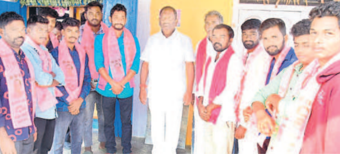
మంత్రి ఈశ్వర్ సమక్షంలో చేరిన యువకులు