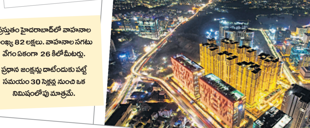
ఈ పదేండ్లలో కట్టిన ప్రైవేటు ఇండ్లు 35. ఆర్యూజీలూ 4. వెహికల్ అందర్ పాసులు 5. ఆర్కీబీలు 6. గ్రేడ్ సివర్ బిల్డు 3. దుర్గం చెరువు కేబుల్ బ్రిడ్జి పంజాగుట్ట, ఇందిరాపార్కు స్టీల్ బ్రిడ్జీలు