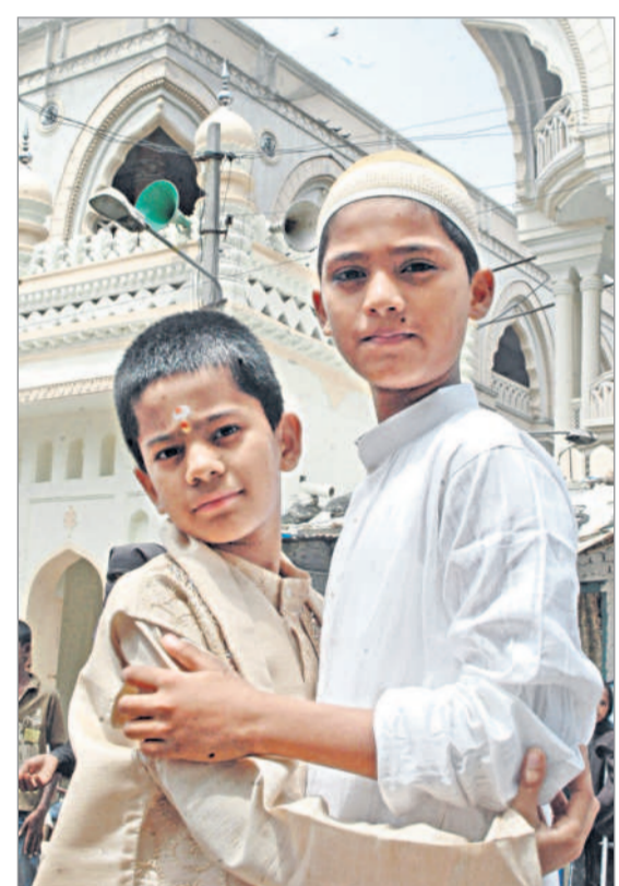
2014 నుంచి 2023 దాకా గత పదేండ్లలో హైదరాబాద్ లో మతఘర్షణలు