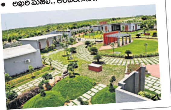
అఖిల మజిలీ.. అందంగానే..

మన బస్ లోనే మన సర్కారు వైద్యం. నగరం నలుమూలలా బస్ స్టేషన్లుగా మారిపోయాయి ఏర్పాటు. పేదలకు ఉచిత వైద్యం, మందులు