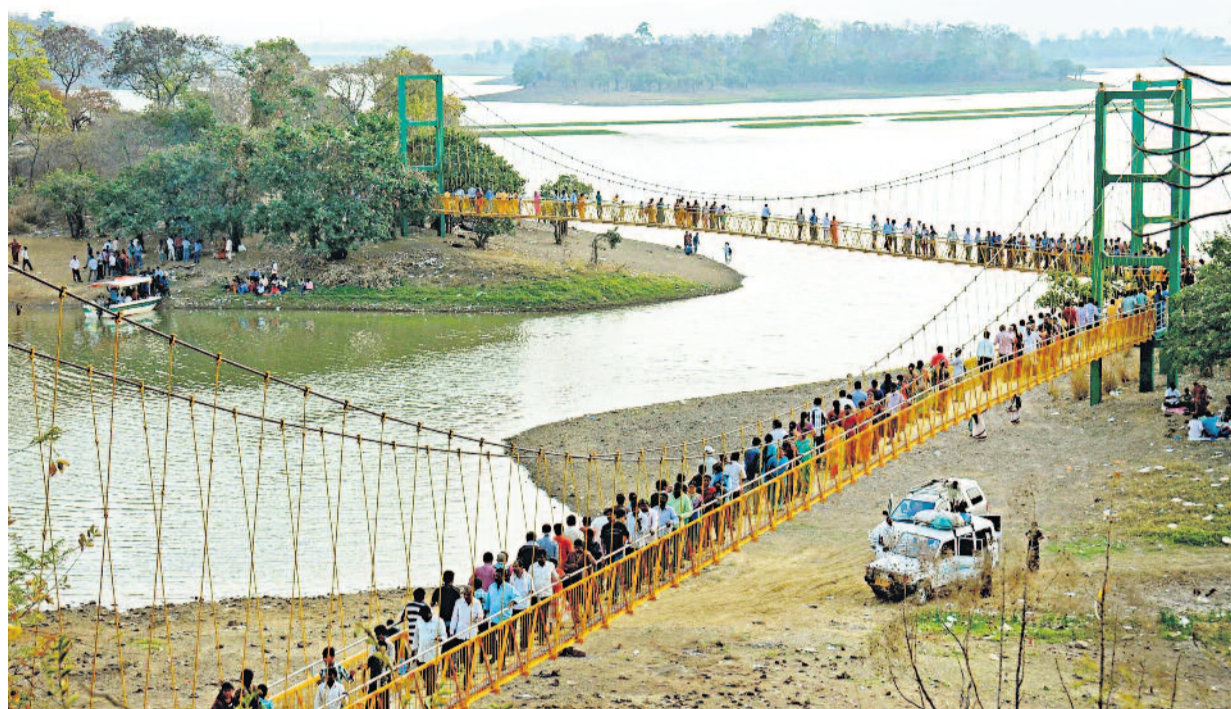
ఉమ్మడి రాష్ట్రంలో తెలంగాణ సంపదపై మూకుమ్మడి దాడి జరిగిందనడానికి లక్షవరం నరహస్య పట్టణ గ్రహణమే ఉదాహరణ. కాకతీయ రాజు ప్రతాపరుద్రుడి హయాంలో నిర్మితమైన ఈ అద్భుత సరస్సు కింద సుమారు 8,700 ఎకరాల ఆయకట్టు ఉండేది. ప్రకృతి అందాల నడుమ అక్షయమైన జల సంపత్తితో ఇది అలరాలేది. కానీ, అప్పటి ప్రభుత్వాల నిర్లక్ష్య దౌరజీవితం లక్షవరానికి శాపంగా వలనమింది. నరహస్య బాగ్ గులు గాలికొదిలారు. వర్షాటకంగాను చిన్నచూపు మాకారు.