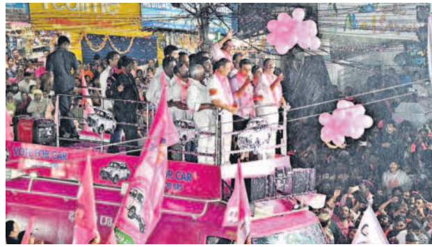
మల్లాపూర్ రోడ్ షోలో..