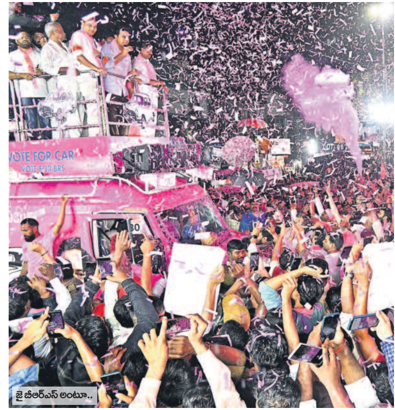
జిల్లా బీఆర్ఎస్ అంటూ..