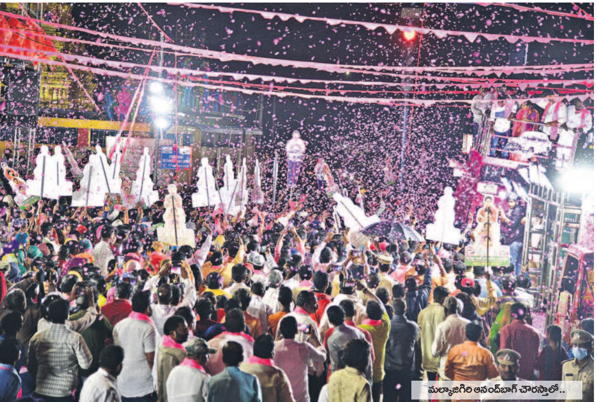
మల్కాజిగిరి ఆనంద్ బాగ్ చారస్టాలో..