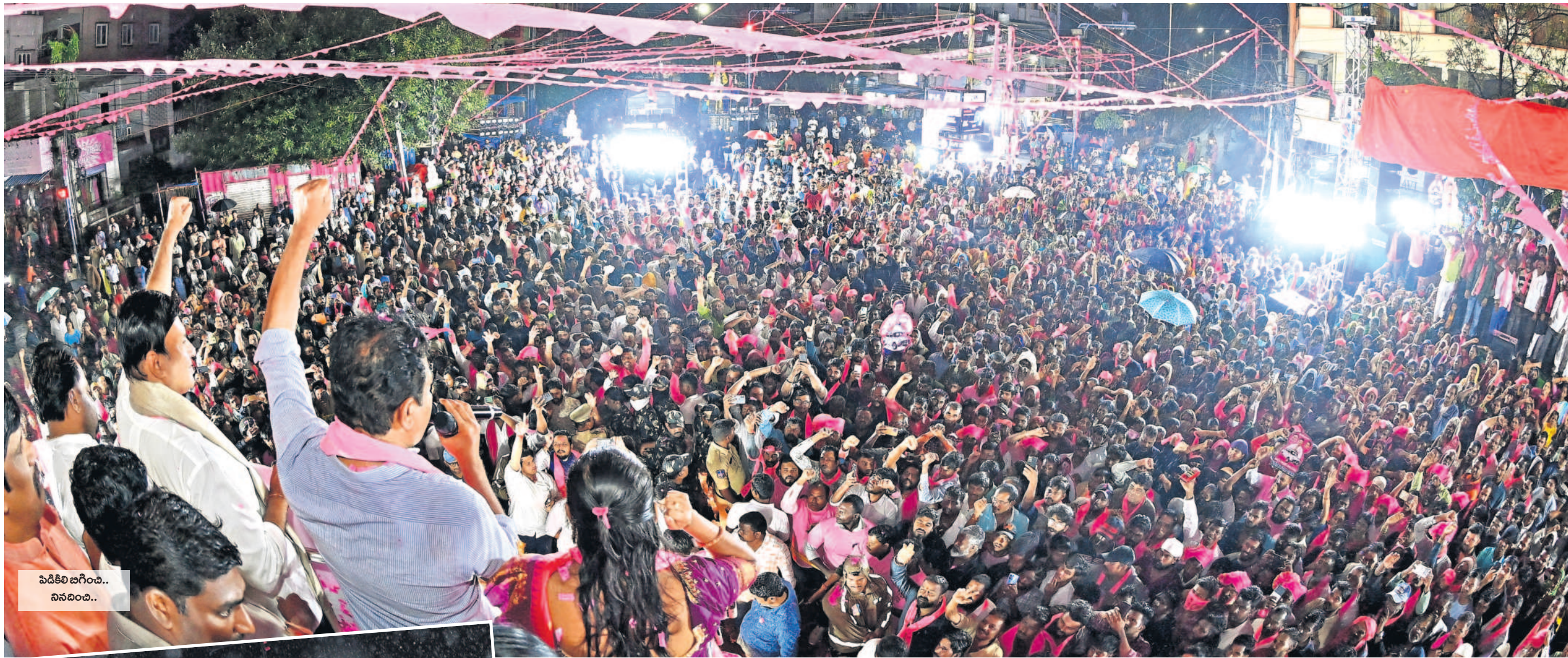
పడికిలి జగింపా.. నిలవండి..