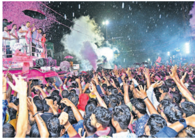
బీఆర్ఎస్ కే మా మద్దతు ఉంటా..