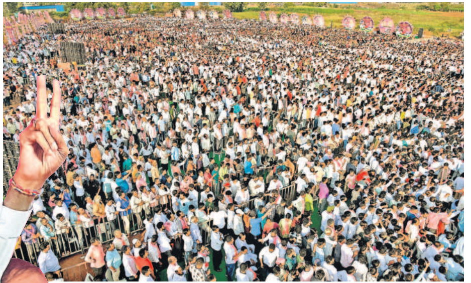
పట్టణంలో సభకు భారీగా హాజరైన జనం