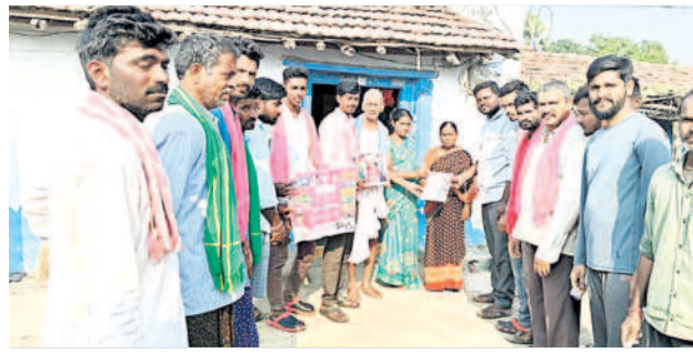
చెన్నూర్ రూరల్ : సుబ్బారాంపల్లిలో