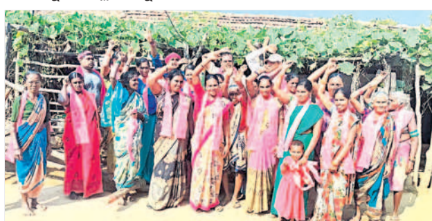
కోటపల్లి : నాగంపేట గ్రామంలో ప్రచారంలో..