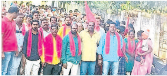
మందవల్లూరులో : శాంతి నగర్ లో ప్రచారం చెన్నూర్ బీఆర్ఎస్ నాయకులు