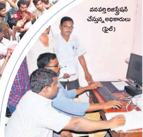
వనపర్తి రిజిస్ట్రేషన్ చేస్తున్న అధికారులు (ఫ్రైల్)