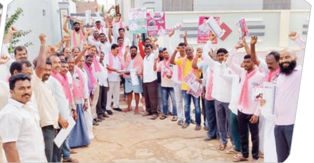
గోపాల్ పేటలో ఎన్నికల ప్రచారం చేస్తున్న బీఆర్ఎస్ నాయకులు