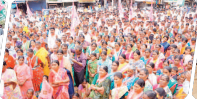
మంత్రి ప్రసంగాన్ని వింటున్న జనం