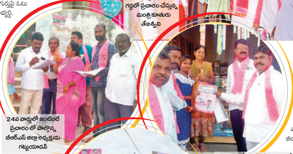
24వ వార్డులో ఇంటింటి ప్రచారంలో పాల్గొన్న బీఆర్ఎస్ జిల్లా అధ్యక్షుడు గట్టుయాదమ్