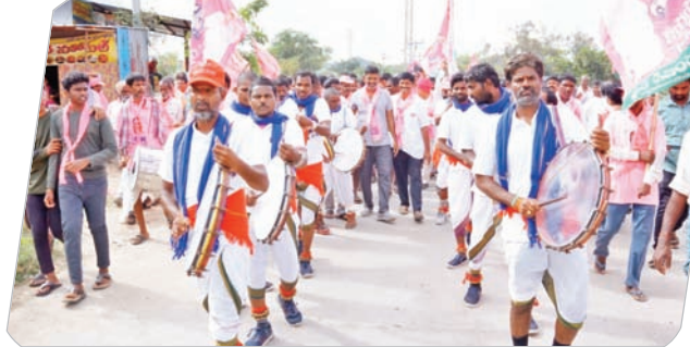
ఖిల్లాపూపురం మండలంలో మంత్రి నిరంజన్ రెడ్డికి డప్పు వాయిద్యాలతో స్వాగతం పలుకుతున్న ప్రజలు.