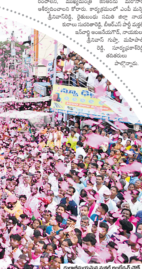
గులాబీమయమైన మక్తల్ అంబేద్కర్ వోక