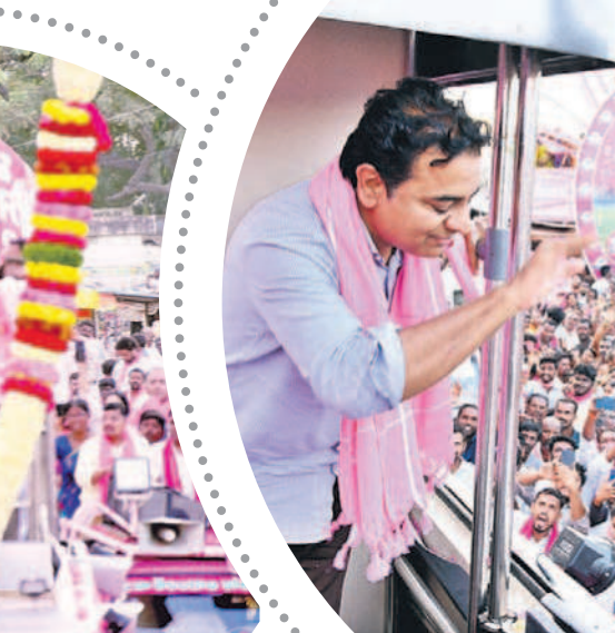
మక్తల్ రోడ్ పోలో ప్రజలకు అభివాదం చేస్తున్న మంత్రి కేటీఆర్