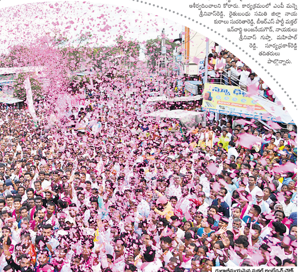
గులాబీమయమైన మక్తల్ అంబేద్కర్ వోకల్