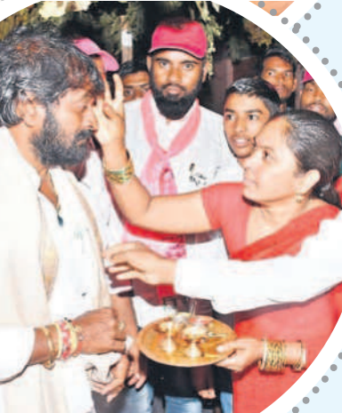
మహబూబ్ నగర్ టౌన్: మంత్రి శ్రీనివాస్ గౌడ్ తిలకం దిద్దుతున్న మహిళ

చల్లూతూ సాగ్గతం పలికారు. ఈ సందర్భంగా ఆయన మాట్లాడుతూ కాంగ్రెస్ పార్టీ 11సార్లు అధికారంలో ఉండి తెలంగాణకు చేసిందిమీ లేదన్నారు. రెండుసార్లు అధికారంలో ఉన్న బీఆర్ఎస్ ప్రభుత్వం పల్లెలను ఎంతో అభివృద్ధి చేసిందన్నారు. ప్రతి గ్రామానికి బీటీరోడ్లు, ఇంటి చెంతకి నీళ్లు తెచ్చిందన్నారు. కాంగ్రెస్ పార్టీ రూ.200 పింఛన్ ఇస్తే తమ హయాంలో మీద తల వారిగా రూ.2,016కు పెంచామన్నారు.