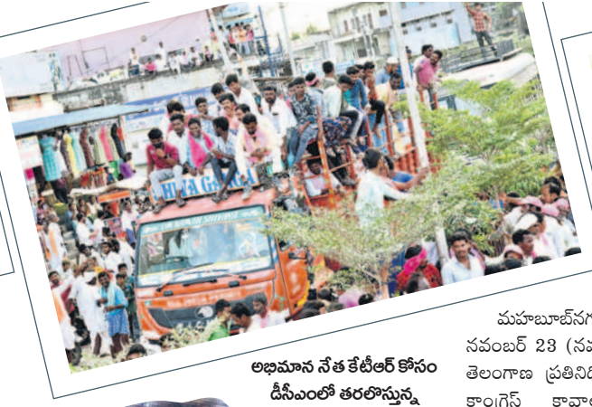
అభిమాన నేత కేటీఆర్ కోసం డిఎంఐలో తరలిస్తున్న యువత