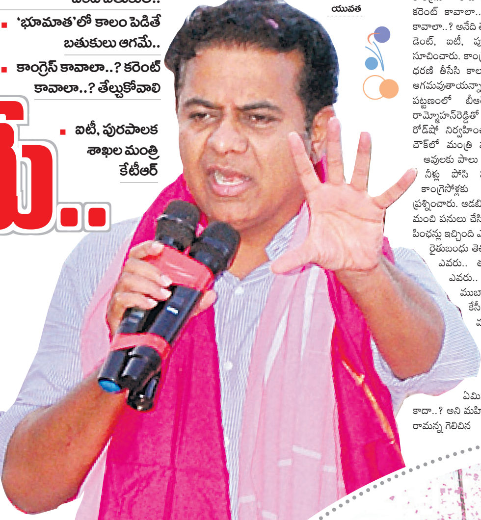
మక్తల్ రోడ్ పోకో ప్రజలకు అభివాదం చేస్తున్న మంత్రి కేటీఆర్