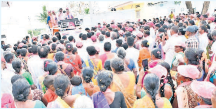
హన్మంట్: మంత్రి శ్రీనివాస్ గౌడ్ ప్రసంగాన్ని వింటున్న గ్రామస్థులు

హన్మంట్, నవంబర్ 23 : 55 ఏండ్ల పాలలో కనీసం తాగునీళ్లవ్వని కాంగ్రెస్ పార్టీ ఇప్పుడు ఓట్ల కోసం గ్రామాల్లోకి వస్తున్నారు.. వారికి ఓటుకో బుద్ధి చెప్పాలని ఎక్సైజ్ సాఖా మంత్రి శ్రీనివాస్ గౌడ్ పిలుస్తున్నారు. గురువారం కార్యక్రమం పల్లి, యూలోని పల్లి గ్రామాల్లో ఆయన ప్రసారం చేస్తున్న ప్రజలు