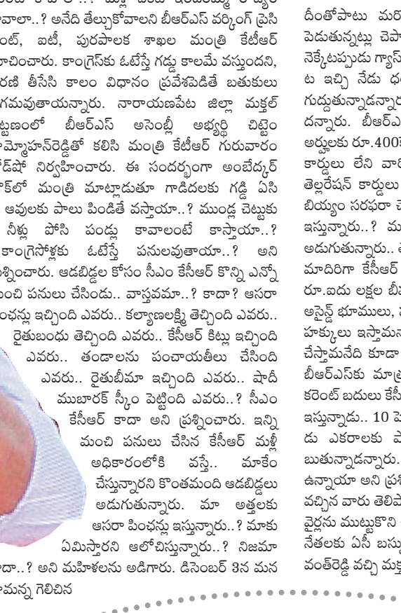
తరువాత కేసీఆర్ మూడోసారి ముఖ్యమంత్రి అయ్యాక కొన్ని కొత్త పథకాలను ప్రారంభించనున్నట్లు తెలిపారు. 18 ఏండ్లు నిండిన ఆడబిడ్డలందరికీ సాభాగ్యలక్ష్మి పథకం కింద నెలకు రూ.3 వేల భృతినీ అందజేస్తామన్నారు. దీంతోపాటు మరో నాలుగు కొత్త పథకాలు ప్రవేశ పెడుతున్నట్లు చెప్పారు. 2014లో ప్రధాని మోదీ గడ్డ నెక్కేటప్పుడు గ్యాస్ సిలిండర్ ధర రూ.400 వేస్తానని మాట ఇచ్చి నేడు ధరలు పెంచుతూ మన పీపుల్ మీడ్ ఇచ్చుతున్నాడన్నారు. రూ.వెయ్యికి గ్యాస్ ధర వేరేం దన్నారు. బీఆర్ఎస్ అధికారంలో వచ్చిన తరువాత అర్ధలక్ష రూ.400 సిలిండర్ అందజేస్తామన్నారు. రేపన్ కార్డులు లేని వారికి మళ్ళీ కొత్త కార్డులు అందజేసి.. తెల్లరేపన్ కార్డులు ఉన్నాకందరికీ జనవరి నుంచి సస్య బియ్యం సరఫరా చేస్తామన్నారు. భూమి ఉన్నాక బీమా ఇస్తున్నారా..? మరీ లేనాక సంగతి ఏమిటి ప్రజలు అడుగుతున్నారా.. తెల్లరేపన్ కార్డు ఉంటే చాలు రైతుబీమా మాదిరిగా కేసీఆర్ బీమా.. ప్రతి ఇంటికి ధీమా పేరిట రూ.ఐదు లక్షల బీమా సదుపాయాన్ని కల్పిస్తామన్నారు. అసైన్డ్ భూములు, పట్టా భూములు ఉన్న వారికి సుపర్వైజర్ హక్కులు ఇస్తామన్నారు. మేమేం చేశాం.. గెలిచాక ఏం చేస్తామనేది కూడా వివరిస్తామన్నారు. ఆలాంటి ధైర్యం బీఆర్ఎస్ కు మాత్రమే ఉందన్నారు. “మాడు గంటల కరెంట్ బదులు కేటీఆర్ అనవసరంగా 24 గంటల కరెంట్ ఇస్తున్నాడు.. 10 హెచ్పీ మోటర్లు మూడు గంటల్లో మూడు ఎకరాలకు పారుతది.. అంటూ రేపంకేరెడ్డి చెబుతున్నాడన్నారు. 10 హెచ్పీ మోటర్లు ఎవరికినా ఉన్నాయో అని ప్రశ్నించగా.. ఎవరికీ లేదంటూ రోడ్ పోకు వచ్చిన వారు తెలిపారు. రేపంకే రెడ్డికి దమ్ముంటే కరెంటు వచ్చిన వారు తెలిపారు. రేపంకే రెడ్డికి దమ్ముంటే కరెంటు నేతలకు ఏసీ బస్సులు పెడతాను.. వెంకటేరెడ్డి లేదా రే వంకేరెడ్డి వచ్చి మక్తల్ నియోజకవర్గంలో ఏ గ్రామానికైనా కరెంట్ వైర్లను