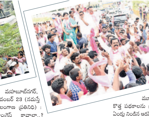
కార్యకర్తలతో కలిసి డ్యాన్స్ చేస్తున్న ఎమ్మెల్యే చిట్టెం