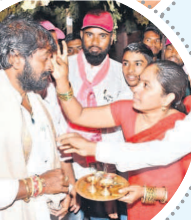
మహబూబ్ నగర్ టౌన్: మంత్రి శ్రీనివాస్ గౌడ్ తిలకం దిద్దుతున్న మహిళ

చల్లూతూ సాగ్గతం పలికారు. ఈ సందర్భంగా ఆయన మాట్లాడుతూ కాంగ్రెస్ పార్టీ 11సార్లు అధికారంలో ఉండి తెలంగాణకు చేసిందిమీ లేదన్నారు. రెండుసార్లు అధికారంలో ఉన్న బీఆర్ఎస్ ప్రభుత్వం పల్లెలను ఎంతో అభివృద్ధి చేసిందన్నారు. ప్రతి గ్రామానికి బీటీరోడ్లు, ఇంటి చెంతే స్కూల్ తెచ్చిందన్నారు. కాంగ్రెస్ పార్టీ రూ.200 పింఛన్ ఇస్తే తమ హయాంలో మీద తల వారీగా రూ.2,016కు పెంచామన్నారు.