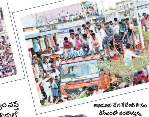
అభిమాన నేత కేటీఆర్ కోసం డిఎంఐలో తరలిస్తున్న యువత