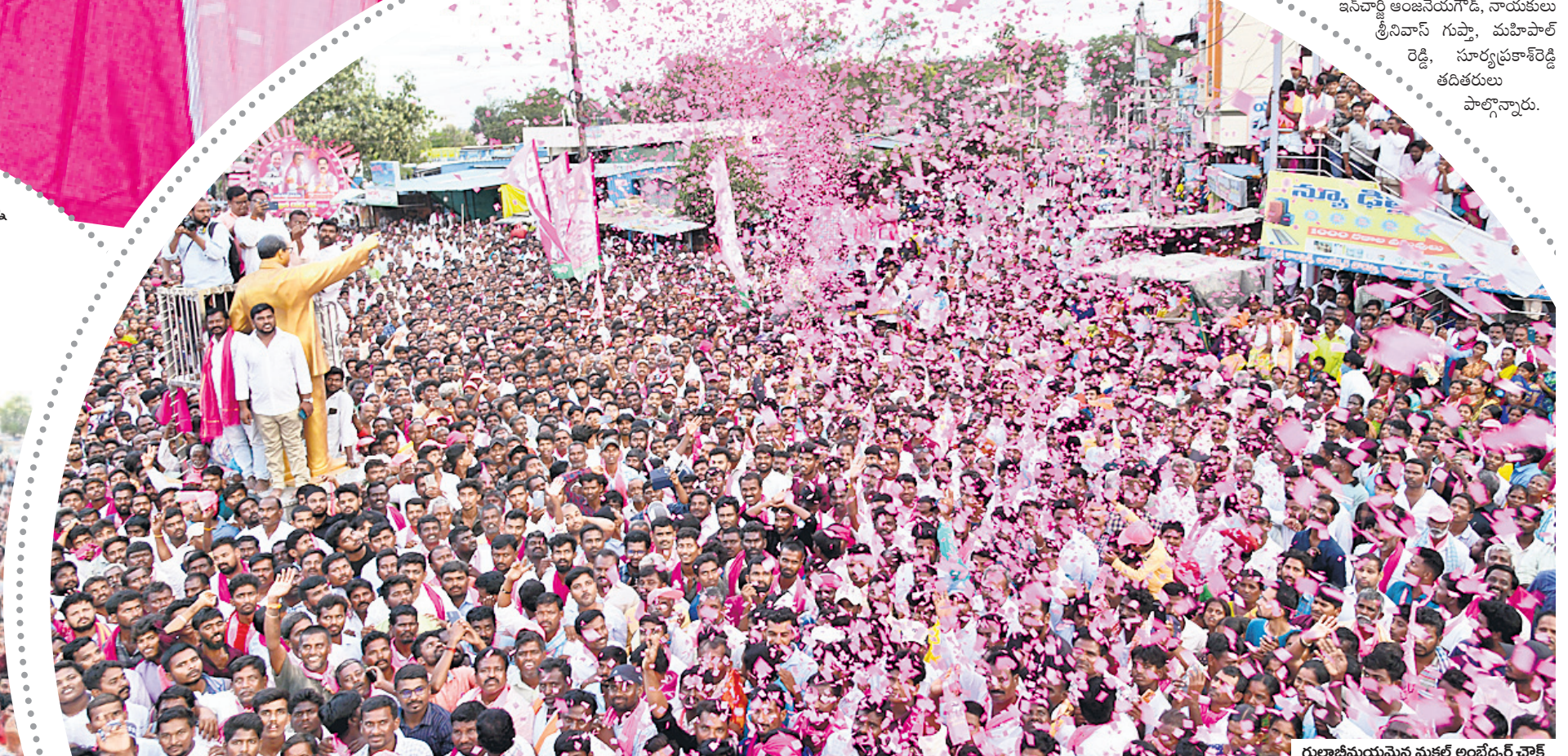
గులాబీమయమైన మక్తల్ అంబేద్కర్ వోక్