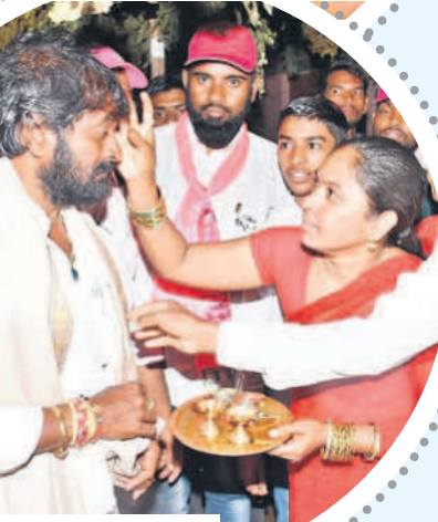
మహబూబ్ నగర్ టౌన్: మంత్రి శ్రీనివాస్ గౌడ్ తిలకం దిద్దుతున్న మహిళ

చల్లూకూ సాగ్గతం పలికారు. ఈ సందర్భంగా ఆయన మాట్లాడుతూ కాంగ్రెస్ పార్టీ 11సార్లు అధికారంలో ఉండి తెలంగాణకు చేసిందిమీ లేదన్నారు. రెండుసార్లు అధికారంలో ఉన్న బీఆర్ఎస్ ప్రభుత్వం పల్లెలను ఎంతో అభివృద్ధి చేసిందన్నారు. ప్రతి గ్రామానికి బీటీరోడ్లు, ఇంటి చెంతకి నీళ్లు తెచ్చిందన్నారు. కాంగ్రెస్ పార్టీ రూ.200 పింఛన్ ఇస్తే తమ హయాంలో మీద తల వారీగా రూ.2,016కు పెంచామన్నారు.