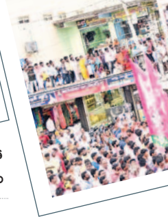
మక్తల్లో మంత్రి కేటీఆర్ కావాలా..?