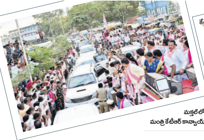
కేటీఆర్ ప్రసంగాన్ని ఆసక్తిగా వింటున్న ప్రజలు

చల్లూకూ సాగ్గతం పలికారు. ఈ సందర్భంగా ఆయన మాట్లాడుతూ కాంగ్రెస్ పార్టీ 11సార్లు అధికారంలో ఉండి తెలంగాణకు చేసిందిమీ లేదన్నారు. రెండుసార్లు అధికారంలో ఉన్న బీఆర్ఎస్ ప్రభుత్వం పల్లెలను ఎంతో అభివృద్ధి చేసిందన్నారు. ప్రతి గ్రామానికి బీటీరోడ్లు, ఇంటి చెంతకి నీళ్లు తెచ్చిందన్నారు. కాంగ్రెస్ పార్టీ రూ.200 పింఛన్ ఇస్తే తమ హయాంలో మీద తల వారీగా రూ.2,016కు పెంచామన్నారు.