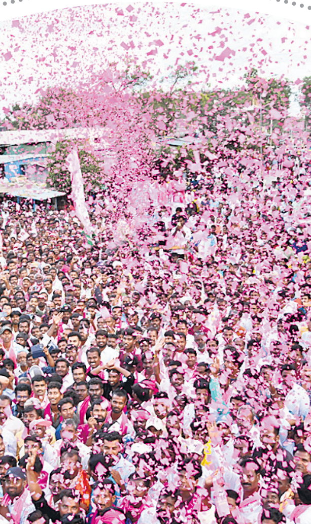
గులాబీమయమైన మక్తల్ అంబేద్కర్ చౌకీ