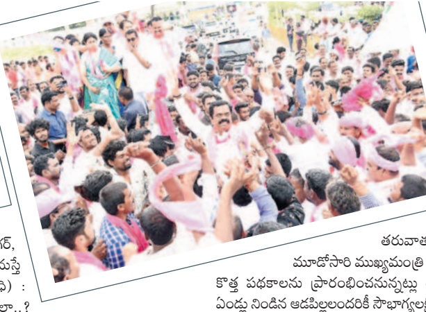
కార్యకర్తలతో కలిసి డ్యాన్స్ చేస్తున్న ఎమ్మెల్యే చిట్టెం