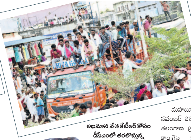
అభిమాన నేత కేటీఆర్ కోసం డిఎంఐలో తరలిస్తున్న యువత