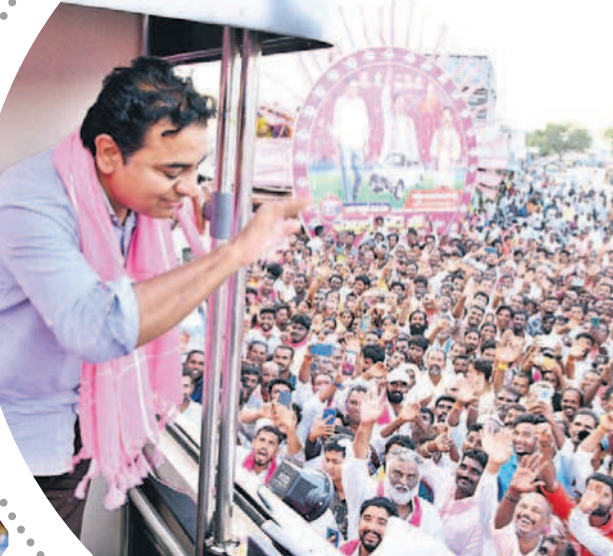
మక్తల్ రోడ్ పోలో ప్రజలకు అభివాదం చేస్తున్న మంత్రి కేటీఆర్