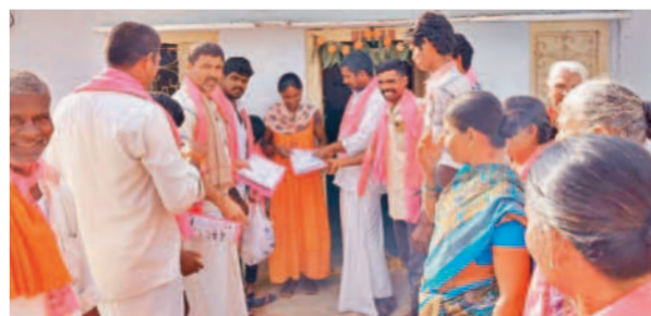
కోయిలకొండ మండలంలో ప్రచారం నిర్వహిస్తున్న బీఆర్ఎస్ నాయకులు

మరికల్, నవంబర్ 23: ప్రజా సంక్షేమం కోసం పాటు