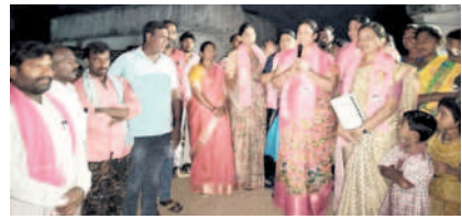
వాల్యండాలో ప్రచారం నిర్వహిస్తున్న నిత్యమ్మ

దంతాలపల్లి: మండలంలోని కుమ్మరికుంట్ల, రేపోడి, పెద్దముప్పారం, దాట్ల, దంతాలపల్లి, బీరిశెట్టిగూడెం, ఆగపేట, గున్నెపల్లి గ్రామాల్లో