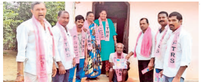
కురువి: చింతపల్లిలో ఇంటింటా ప్రచారం నిర్వహిస్తున్న బీఆర్ఎస్ శ్రేణులు