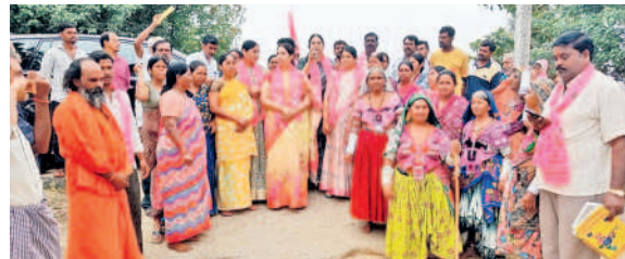
పడమటిగూడెం చారితండాలో ప్రచారం చేస్తున్న మహిళా నాయకులు