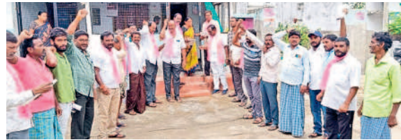
పెద్దనాగారంలో ప్రచారం నిర్వహిస్తున్న యాదగిరిరెడ్డి, నాయకులు