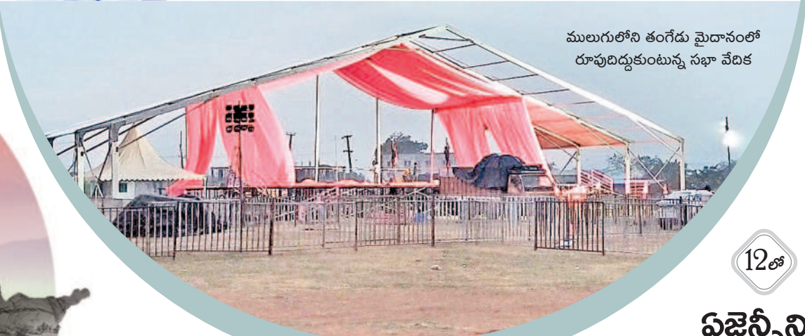
ములుగులోని తంగేడు మైదానంలో రూపుదిద్దుకుంటున్న సభా వేదిక