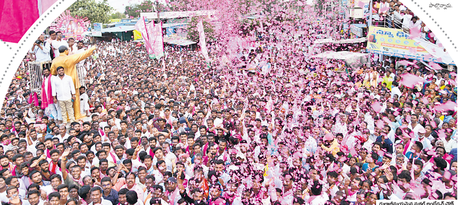
గులాబీమయమైన మక్తల్ అంబేద్కర్ చౌకీ