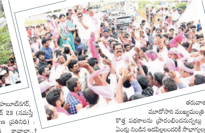
అభిమాన నేత కేటీఆర్ కోసం డిఎంఐలో తరలివస్తున్న యువత