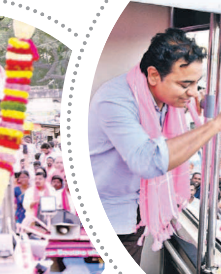
మక్తల్ రోడ్ పోలో ప్రజలకు అభివాదం చేస్తున్న మంత్రి కేటీఆర్