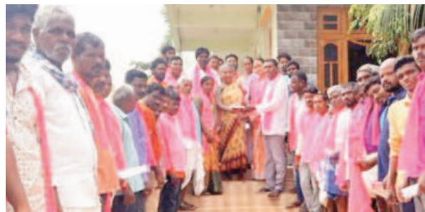
పేట పట్టణంలో ప్రచారం నిర్వహిస్తున్న బీఆర్ఎస్ నాయకులు