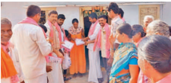
కోయిలకొండ మండలంలో ప్రచారం నిర్వహిస్తున్న బీఆర్ఎస్ నాయకులు