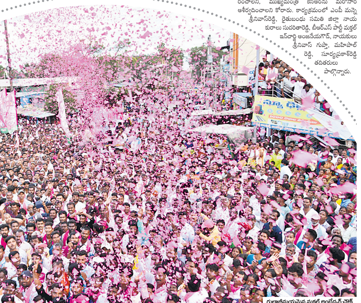
గులాబీ ముయమిన మక్తల్ అంతర్గత వోకల్ రెడ్డి, సూర్యప్రకాశరెడ్డి తదితరులు పాల్గొన్నారు.