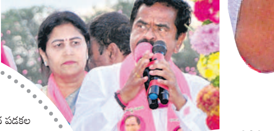
మక్తల్ రోడ్ షోలో ప్రజలకు అభివృద్ధి చెప్పిన మంత్రి కేటీఆర్