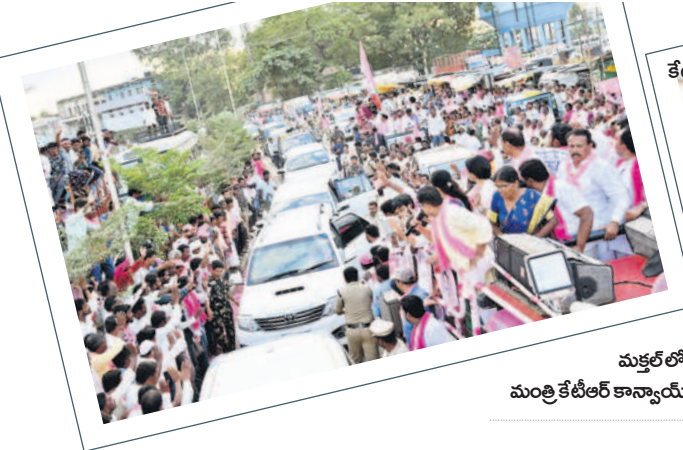
కేటీఆర్ ప్రసంగాన్ని ఆసక్తిగా వింటున్న ప్రజలు

చల్లుతూ సాగడం పలికారు. ఈ సందర్భంగా ఆయన మాట్లాడుతూ కాంగ్రెస్ పార్టీ 11సార్లు అధికారంలో ఉండి తెలంగాణకు చేసిందిమీ లేదన్నారు. రెండుసార్లు అధికారంలో ఉన్న బీఆర్ఎస్ ప్రభుత్వం పల్లెలను ఎంతో అభివృద్ధి చేసిందన్నారు. ప్రతి గ్రామానికి బీటీరోడ్డు, ఇంటి చెంతకి సీక్రెట్ తెచ్చిందన్నారు. కాంగ్రెస్ పార్టీ రూ. 200 కోట్లను హయాంలో మీదు తల వారిగా రూ. 2,016కు పెంచామన్నారు.