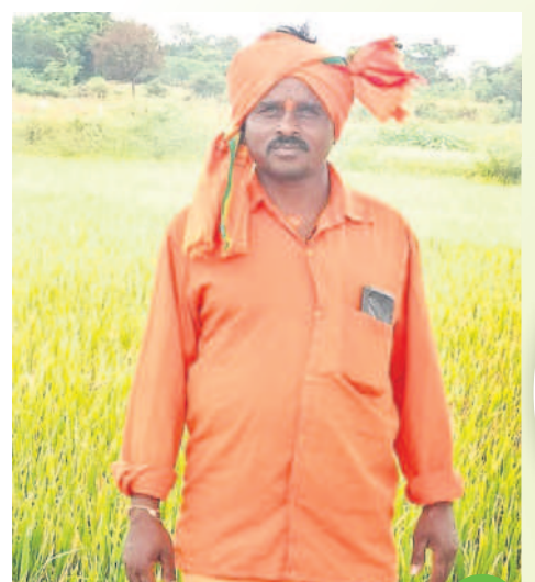
కౌలుదారు చట్టంతో నిత్యం సమస్యలే

కౌలుకు ఇవ్వడానికి వెనకాడతారు. ఫలితంగా రైతులకు ఉపాధి మార్గాలు తగ్గడంతో పాటు ఉత్పత్తి, దిగుబడి తగ్గుతుంది. కౌలు చట్టం దశాబ్ది రాజ్యానికి బాధా తలుపులు తెరుస్తుంది. ఇలాంటి ప్రమాదకరమైన చట్టాన్ని కాంగ్రెస్ తీసుకొస్తామనడంతో రైతులకు ఉద్యోగం అని అందోళన చెందుతున్నారు. దాని ప్రకారం రైతులు తమ భూమిని కౌలుకు ఇస్తే కచ్చితంగా ప్రభుత్వ రికార్డుల్లో నమోదవుతుందని, దీంతో భూయజమాన్య హక్కులకు ఎవరూ పెట్టే ప్రమాదం వస్తుందని గుబులు పడుతున్నారు. అంతేకాకుండా న్యాయస్థానంలో నిలబెట్టే పరిస్థితి ప్రమాదం ఉంది. దీంతో పల్లెల్లో కౌలు చిచ్చు రాజకీయంపాటు ఊర్ధ్వ ప్రకాశకం దెబ్బతింటుంది. రైతులు తమ భూములను