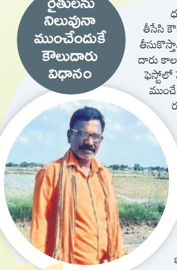
రైతులను నిలుపునా ముంచేందుకే కౌలుదారు విధానం

- గంగి పర్వతరాజు, గొట్టిమక్కల, దేవరకొండ దూరల్