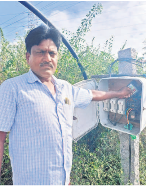
రైతులు బాగుపడడం కాంగ్రెస్ కు ఇష్టం లేదు

రైతు బాగుపడడం కాంగ్రెస్ కు ఇష్టం లేదు. అందుకే సాగుకు 24 గంటల వద్దు మాకు గంటల కరెంట్ చాలంటూ రేపంతేరెక్కే మాట్లాడుతున్నాడు. బీఆర్ఎస్ ప్రభుత్వం 24 గంటల కరెంట్ ఇవ్వడంతో 5 హెచ్పీ మోటర్లు పెట్టి పాలానికి సరిపోయేంత నీటిని పెట్టుకుంటున్నాం. కాంగ్రెస్ వాళ్లు చెప్పినట్లు 10 హెచ్పీ మోటర్లు పెట్టుకుంటే ట్రాన్స్ ఫార్మర్లు పేలిపోతారు. మాకు గంటలకే ఇస్తే అదే సమయంలో అందరూ మోటర్లు అనే చేస్తే సబ్సిడీస్ వల్ల భారం పడి అందుకో ఉన్న ట్రాన్స్ ఫార్మర్లు కూడా కాలిపోతారు. బోర్డర్ నిట్ల కూడా కిందికి పోతాయి. ఇక మళ్లీ మేమే ఆగమవుతాం. ఇప్పుడున్న బీఆర్ఎస్ సర్కారు 24 గంటల కరెంట్ ఇస్తుండడంతో రైతులు ఎప్పుడు టైం దొరికితే అప్పుడు మోటర్లు పెట్టుకుంటున్నారు. దాంతో లోడ్ ఒకే సారి పడడం లేదు. మోటర్లు, ట్రాన్స్ ఫార్మర్లు కాలిపోతాయి. బీఆర్ఎస్ ప్రభుత్వం సరిపోను కరెంట్ ఇస్తుండడంతో రైతులు హాయిగా వ్యవసాయం చేసుకుంటున్నారు. ఈ కాంగ్రెస్ వాళ్లు సమ్మిత్తు మళ్లీ ఆగమవుతారు. అందుకే బీఆర్ఎస్ కే మద్దతిస్తాం.