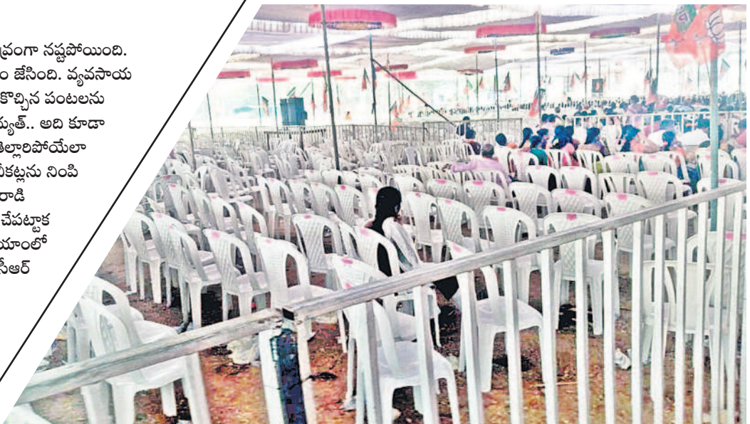
జనం లేక వెలవెలబోయిన బీజేపీ సభ

యాభై ఏండ్ల కాంగ్రెస్ పాలనలో రైతాంగం తీవ్రంగా నష్టపోయింది. అందరికీ అన్నం పెట్టే రైతును హస్తం పార్టీ ఆగం జేసింది. వ్యవసాయ రంగాన్ని పూర్తిగా భ్రష్టు పట్టించిన ఘనత, చేతికొచ్చిన పంటలను ఎండబెట్టిన చరిత్ర హస్తం పార్టీదే. అరకొర విద్యుత్.. అది కూడా తెల్లదాకా ఇచ్చి, వేలాది రైతుల బతుకులను తెల్లరిపోయేలా చేసిన పాపం కాంగ్రెస్ దే. తెలంగాణలో కటిక వీకట్లను నింపి రైతులను వలసల బాట పట్టించింది. కానీ, పోరాడి సాధించుకున్న స్వరాష్ట్రంలో కేసీఆర్ అధికారం చేపట్టాక వ్యవసాయం మళ్ళీ చిగురించింది. కాంగ్రెస్ హయాంలో పడవుగా మారిన లక్షలాది ఎకరాల భూమి కేసీఆర్ పాలనతో మళ్ళీ పచ్చబడింది. దండ్రిగా నీళ్లు, నిరంతర విద్యుత్ కారణంగా తెలంగాణ దేశానికి అన్నపూర్ణగా మారింది. అయితే, రైతులు దర్జాగా బతుకుతుండడం సహించలేని కాంగ్రెస్ పార్టీ.. మళ్ళీ కుట్రలకు తెర లేపింది. 24 గంటల కరెంట్ వ్యధా అని, మూడు గంటలు చాలని, ఉన్న మోటర్లు ఊడబీకి, 10 హెచ్పీ మోటర్లు పెట్టుకోవాలని అన్నదాతలను ఆగం చేస్తున్నది. రైతు భూములకు రక్షణ కల్పిస్తున్న ధరణిని ఎత్తేస్తామని చెబుతున్నది. తాము దర్జాగా బతుకుతుండడాన్ని కాంగ్రెస్ నేతలు ఓర్పుకోలేక పోతున్నారని, ఓటుతో బుద్ధి చెబుతామని రైతులు స్పష్టం చేస్తున్నారు.