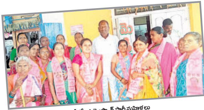
మంత్రి సమక్షంలో బీఆర్ఎస్ లో చేరిన వైఎస్సార్ పార్టీ మహిళలు