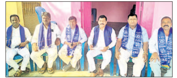
మాట్లాడుతున్న మాల సంఘాల జేపీసీ నాయకులు