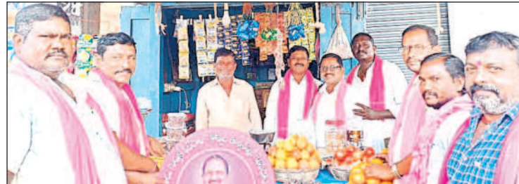
గొల్లపల్లి: ప్రచారం చేస్తున్న బీఆర్ఎస్ నాయకులు