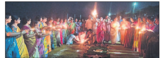
గోదావరి నదికి హారతినిస్తున్న భక్తులు, దేవస్నాన సిబ్బంది