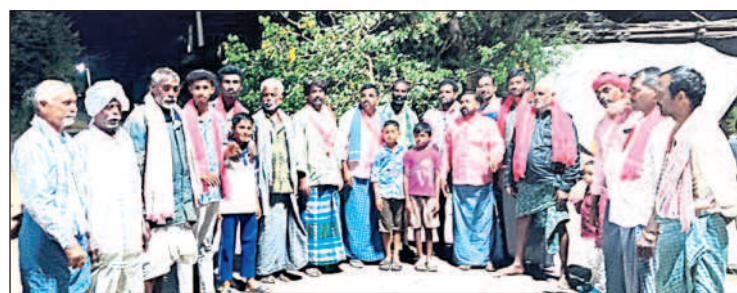
పెగడపల్లి: ఏడుమోటలపల్లిలో ప్రచారం చేస్తున్న బీఆర్ఎస్ నాయకులు