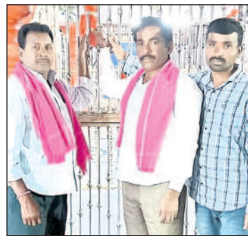
ముడుపు కడుతున్న నాయకులు

పెగడపల్లి, నవంబర్ 23: బీఆర్ఎస్ ధర్మపురి నియోజకవర్గ ఎమ్మెల్యే అభ్యర్థి, రాష్ట్ర మంత్రి కొప్పుల ఈశ్వర్ భారీ మెజార్టీతో గెలవాలని కోరుతూ గురువారం బీఆర్ఎస్ యూత్ నాయకుల ఆధ్వర్యంలో ఎన్నికల ప్రచారం చేపట్టారు. ఏడుమోటలపల్లి, నందగిరి, ఐతుపల్లి, సుద్దపల్లి, నామాపూర్ గ్రామాలలో కొప్పుల ఈశ్వర్ ను భారీ మెజార్టీతో గెలిపించాలని కోరారు. కార్యక్రమంలో ఆయా గ్రామా