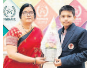
విద్యార్థిని అభినందిస్తున్న డైరెక్టర్