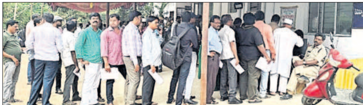
పోస్టల్ బ్యాలెట్ వేసేందుకు బారులు తీరిన ఉద్యోగులు

సర విభాగాల్లో విధులు నిర్వహించే వారు కూడా ఓటు హక్కును పోస్టల్ బ్యాలెట్ ద్వారానే వినియోగించుకుంటున్నారు. ఈనెల 20 నుంచి పోస్టల్ ఓట్ల ప్రక్రియ ప్రారంభం కాగా, ముగియ గడువు సమీపిస్తున్న క్రమంలో రోజురోజుకు పోస్టల్ ఓట్ల సంఖ్య పెరుగుతుంది. ఒక్కో సెగ్మెంట్ పరిధిలో 300కు పైగా ఉద్యోగులు పోస్టల్ బ్యాలెట్లు వేస్తున్నట్లు ఎన్నికల అధికారులు పేర్కొంటున్నారు. గురువారం కరీంనగర్ అసెంబ్లీ రిటర్నింగ్ అధికారి కార్యాలయంలో ఉద్యోగులు వందల సంఖ్యలో బారులు తీరారు. వీరంతా రెండు ఫెసిలిటీషన్ కేంద్రాల్లో పోస్టల్ బ్యాలెట్ ద్వారా ఓటు హక్కు వినియోగించుకున్నారు. సాయంత్రం ఆరు గంటల వరకు కూడా ఓటు హక్కు వినియోగించుకునేందుకు ఉద్యోగులు ఆరేవో కార్యాలయానికి రావడం కనిపించింది. పోస్టల్ ఓట్లు వేసే విధానం కూడా ఈసారి ఎన్నికల కమిషన్ మార్చింది. గతంలో పంపిణీ కేంద్రాలతో పాటు పోలింగ్ విధులు నిర్వహించే కేంద్రంలో కూడా పోస్టల్ ఓటు వేసే అవకాశముండేది. అయితే, ఈసారి