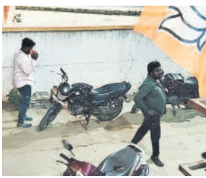
బీజేపీ కార్యాలయంలో గొడవ పడి బయటకు వస్తున్న కార్యకర్తలు

సిరిసిల్ల రూరల్, నవంబర్ 23: తగ్గట్లపల్లి మండలం కేంద్రంలోని బీజేపీ కార్యాలయంలో పార్టీ నేతలు గొడవ పడ్డారు. పార్టీ కార్యాలయంలో బూతు సైసల పంపకాల విషయంలో పలువురు నాయకులు తమ బూత్లపై లు ఇవ్వాలని నిలదీయడంతో తీవ్ర వాగ్వాదం జరిగింది. ఈ విషయం బయటకు రావడంతో పలువురు విలేజరులు అక్కడి వెళ్లగా, అంతర్గత సమావేశమని చెప్పి, పార్టీ కార్యాలయం మూసివేశారు. పలువురు నాయకులు గొడవపడడంతో వారి చొక్కాలు చినిగాయి. ఈ ఘటన సోషల్ మీడియాలో వైరల్ గా మారగా, మండలంలో చర్చానియాంశమైంది.