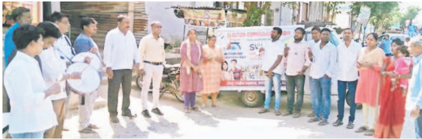
కళాజాత ప్రదర్శనల ద్వారా ఓటర్లకు అవగాహన కల్పిస్తున్న కళాకారులు (ఫైల్)