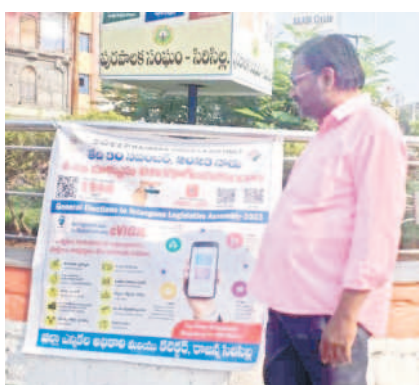
జిల్లాలో ఏర్పాటు చేసిన స్వీచ్, సీ-విజిల్ ఫైక్స్

యువకులను ఓటు వేసేలా చూసేందుకు సామాజిక మాధ్యమాలను జిల్లా యంత్రాంగం వేదికగా ఉపయోగించుకుంటుంది. ట్విట్టర్ (ఎక్స్), ఫేస్ బుక్, వాట్సాప్తోపాటు ఇతర సామాజిక మాధ్యమాల్లో