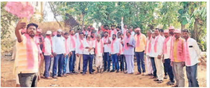
ఝాన్సీ : ఎల్లోల గ్రామం నుంచి సీఎం సభకు వెళ్తున్న నాయకులు, కార్యకర్తలు