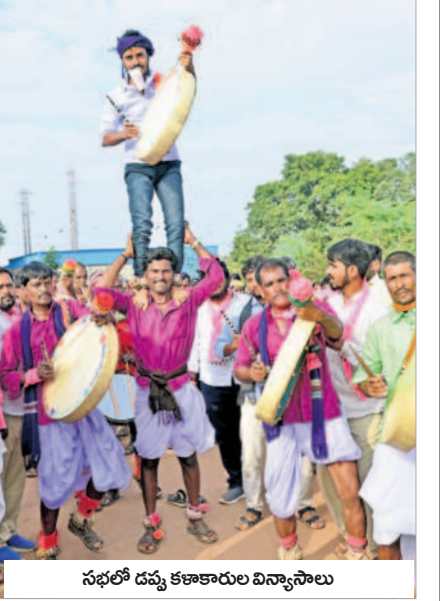
సభలో డప్పు కళాకారుల విన్యాసాలు