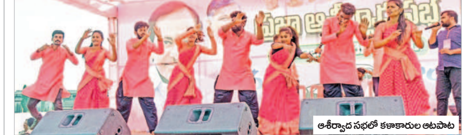
ఆశీర్వాద సభలో కళాకారుల అటపాట