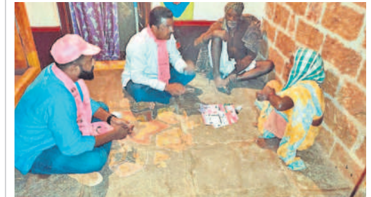
న్యూఢిల్లీ : రేజింత్ లో వృద్ధులతో మాట్లాడుతున్న నాయకులు