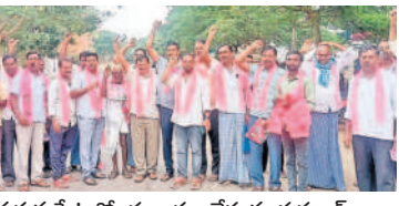
నర్సన్నపేటలో ప్రచారం చేస్తున్న సర్పంచ్