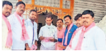
ప్రచారం చేస్తున్న బీఆర్ఎస్ నాయకులు