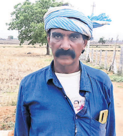
10హెచ్పీ మోటరుతో వ్యవసాయం చేయాలేం