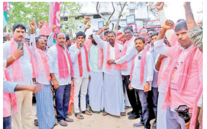
ఎమ్మెల్యే మహేశ్ రెడ్డి సమక్షంలో బీఆర్ఎస్ లో చేరుతున్న మోతూర్ గ్రామానికి చెందిన బీజేపీ నాయకులు, కార్యకర్తలు