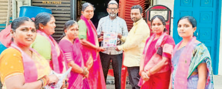
గిర్కాజీపేట: 25వ డివిజన్లో ప్రచారం చేస్తున్న బీఆర్ఎస్ శ్రేణులు