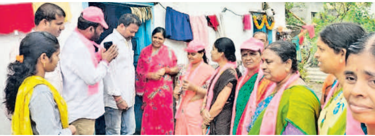
కరీమాబాద్: ప్రచారంలో పాల్గొన్న 40వ డివిజన్ నాయకులు