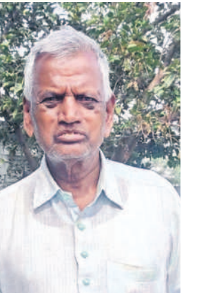
-ఎనుగు జంగారెడ్డి, ఎనుగువాణి గూడెం, భూదాన్ సచివాలి